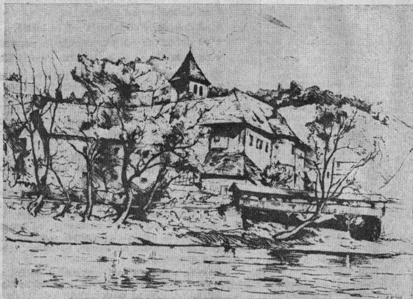
BOŽIDAR JAKAC: LAŠKO (S »ČRNIM MOSTOM«), JEDKANICA — 1955

Vodstvu muzejske zbirke se moramo zahvaliti za umetniški užitek. S prirejanjem občasnih razstav nam