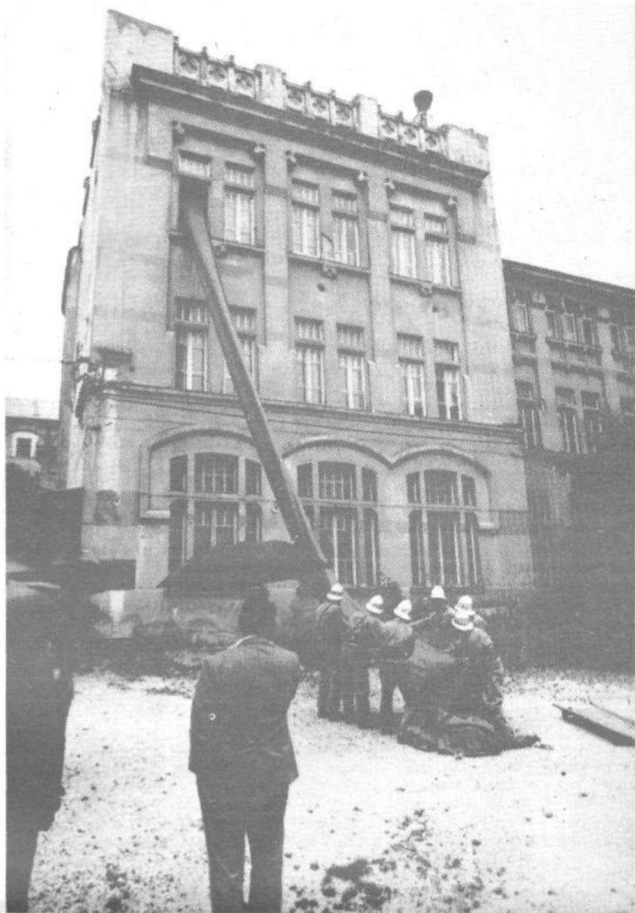
Gasilci so reševali s spustnimi nosili