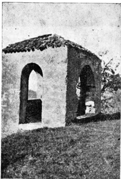
Opazovališče dornberških grofov.

in strn, da sem že z žalostjo v srcu Vezuv le od daleč pozdravljal. No, pa vendar sem srečno končal to divjo ježo v prijetnem smrekovem gozdiču nad vinogradi. Tu me je čakal na mršavem kljusetu vodnik, ki je začudeno prašal, kod sem bil toliko časa. Povedal sem mu, da sem se učil spotoma konjske abecede, pa ni razumel.