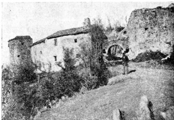
Tabor pri Dornbergu.

v naši deželi. Bili so to kraji, kjer so za časa turških vpadov zažgali kresove in naznanjali deželanom, da se bliža turška vojska. Znano je Gradišče pri Vipavi, nad Ajdov