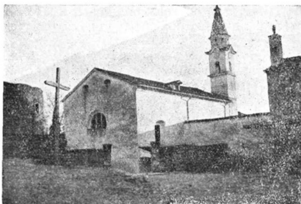
Samostan v Sv. Križu.