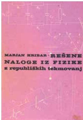
Prva zbirka: Naloge od začetka tekmovanj do leta 1970.

Na spodnjih slikah so naslovnice do sedaj izdanih zbirk nalog in rešitev z republiških oziroma državnih tekmovanj – od začetka tekmovanj do vključno leta 2013.