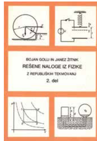
Druga zbirka: Naloge od leta 1971 do 1983.