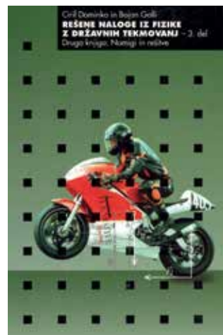
Tretja zbirka. Prva knjiga: Vademekum in naloge. Druga knjiga: Namigi in rešitve. Od leta 1984 do 1998.