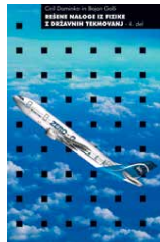
Četrta zbirka: Naloge od leta 1999 do 2013.