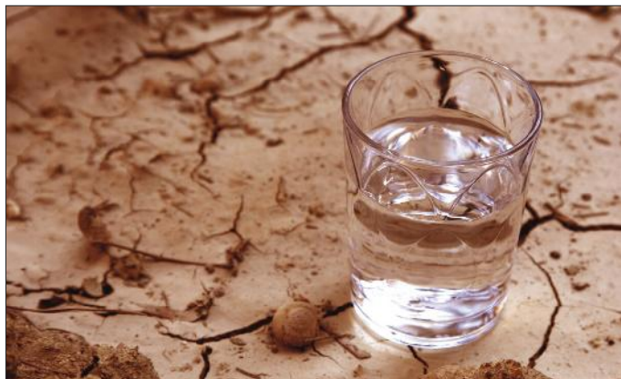
Skrb za ustrežno pitno vodo

Več informacij na spletni strani: www.ibled.si , www.ivz.si .