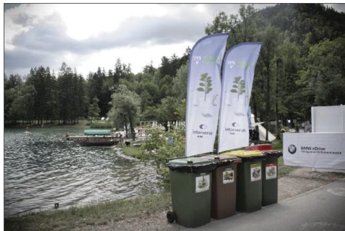
Primer urejenega ločevanja smeti na prireditvi

ravnanja z mešanimi odpadki in ekološka zavest na drugi kažejo velik napredek pri ločevanju odpadkov ob prireditvah. Podjetje Interseroh d.o.o. je na prireditvi BMW Clean Water Regatta skupaj z nami poskrbelo za celostno ravnanje z odpadki. Tako je bilo kar 91 % zbrane količine odpadkov ločenih frakcij in le 9 % mešanih odpadkov, ki smo jih odložili na deponijo. Tako zavzetih organizatorjev si na Bledu želimo tudi v prihodnje.