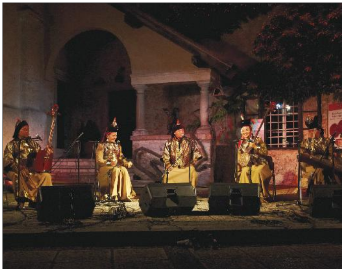
Utrinek iz Okarine.

Nastop skupine Family Atlantica je zaokrožil že 24. izdajo mednarodnega glasbenega Okarina etno festivala na Bledu, ki je tudi tokrat popestril avgustovske večere na gradu in v Zdraviliškem parku. Na enem najstarejših etno festivalov v evropskem prostoru, ki ga na Bledu pripravljajo v okviru Zavoda za kulturo so se v sedmih odlično obiskanih koncertnih večerih – več kot 5.000 obiskovalcev so našli organizatorji - etno glasbe željnemu občinstvu predstavile vrhunske zasedbe z vsega sveta.