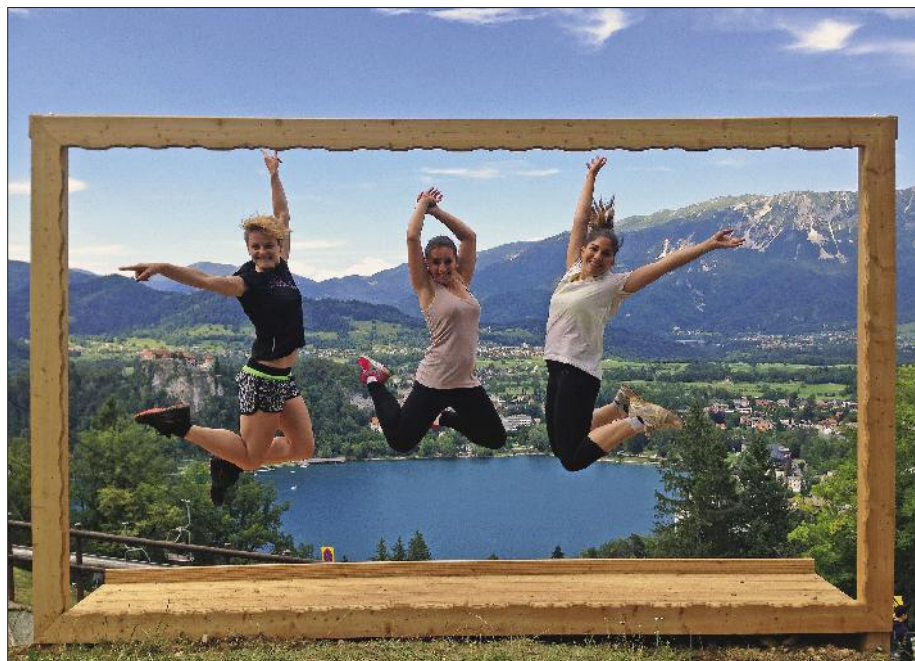
»Selfie z najlepšim razgledom«

V Grajskem kopališču smo se na poletno sezono dobro pripravili. Poleg rednih vzdrževalnih del smo investirali obnovo lesenega pomola v zadnjem delu kopališča. Tudi letos pri nas vihra Modra zastava, ki zagotavlja, da je kopališče urejeno v skladu z zahtevnimi mednarodnimi merili za kakovost kopalne vode, čistočo, varnost in okoljsko odgovorno obnašanje. Sodelujemo v akciji Naj kopališče in za nas še vedno lahko glasujete na spletni strani http://www.dj-slovenija.si/naj-kopalisce ali z glasovnico, ki jo do-