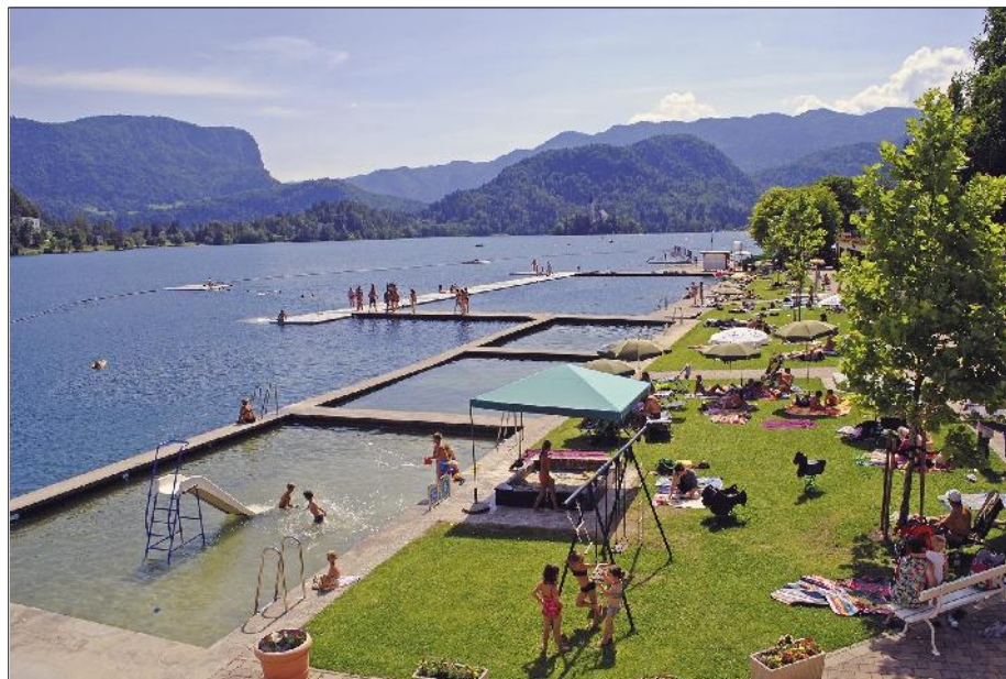
Poletni živžav na Grajskem kopališču

bite v kopališču. Vrsta uvrstitev na prvo in drugo mesto v zadnjih letih je najlepša nagrada za vse sodelavce, ki skrbijo, da je kopališče prijetno in varno za obiskovalce. Letos nam jo je pošteno zagodlo vreme, zaradi česar se soočamo z izpadom prihodka. A tako pač je pri dejavnostih, ki so odvisne od vremena. Kopališče bo sicer ob primernem vremenu odprto še vse do 15. septembra. Predlanskim smo v ponudbo vključili najem kajakov, letos smo dokupili še dva. Tako v »Grajcu« lahko uživate tudi takrat, ko vreme ni ravno najprimernejše za kopanje. Pripravljamo celostni načrt za ureditev kopališča, pa tudi nove programe za popestritev poletnih dni. Informacije o kopališču so na voljo na spletni strani www.kopalisce-bled.si oziroma www.grajc.si ter na facebooku.