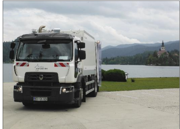
Novo smetarsko vozilo

Novo vozilo ima precej izboljšav, med njimi je treba omeniti motor (Euro 6) s protihrupno zaščito 80 dB, je tudi ekološko naravnano in bistveno manj onesnažuje okolje, prav tako vse svoje funkcije opravlja z motorjem v prostem teku (brez povišanih vrtljajev), samo korito, v katerega se praznijo zabojniki, pa se ob pranju zapre oz. zaščiti z zavesami. Nadgradnja omogoča zbiranje in prevažanje mešanih komunalnih odpadkov in ločeno zbranih frakcij (papir, steklo, embalaža, bio ...). Vgrajen ima stiskalni mehanizem, ki volumen odpadkov zmanjša za 4-krat. Sistem omogoča praznjenje dveh posod hkrati (v medsebojni neodvisnosti), različne hitrosti praznjenja, pranje zabojnikov ... Tako kot druga naša smetarska vozila prazni samo tipizirane zabojnike z vgrajenim čipom. Vsako praznjenje sproti zabeleži, podatke pa pošilja v naš obračunski center. Z delom je začel takoj naslednji dan, zato ste ga morda že opazili.