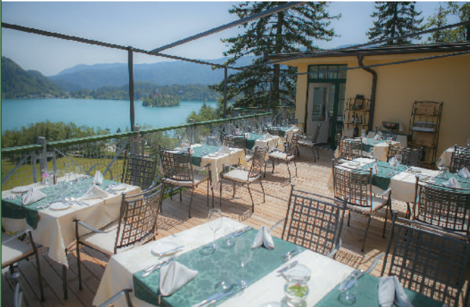
Terasa z najlepšim pogledom na blejski otok

Hotel Triglav Bled in Restavracija 1906 predstavljata: