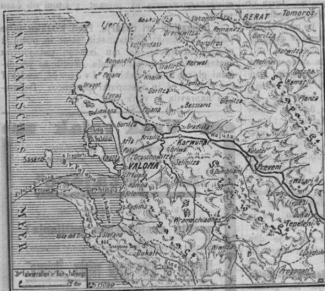
Zum Vormarsch auf Valona.

Glasom poročil agencije Havas so avstro-ogrsko in bolgarske čete zavzele Berat in prodirajo proti Valoni, ki je ena najvažnejših postojank na Balkanu. Kakor znano, so Italijani Valono svoj čas zasedli in si hoteli s tem vstvariti temelj za nadaljne svoje balkanske aspiracije. Ker se bodejo sigurno v kratkem v Valoni in njenem ozemlju odigrali velevažni dogodki, prinašamo tozadavni zemljevid, ki bode cenjene čitatelje gotovo zanimal.