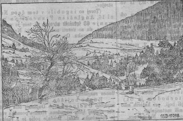
Osterreichischer Wachtposten vor Plevlje.

Zapadno bojišče. V noči od 31. januarja poskusili so majhni angleški oddelki napad proti našim postojankam zapadno Messines (Flandrija). Bili so vsi nazaj, ženi, ko se jim je na enem kraju mimogred posrečilo, vsiliti v naše jarke. Pri Fricourt (vzhodno od Alberta) onemogočili smo z njem sovražniku zasedenje neke od njega