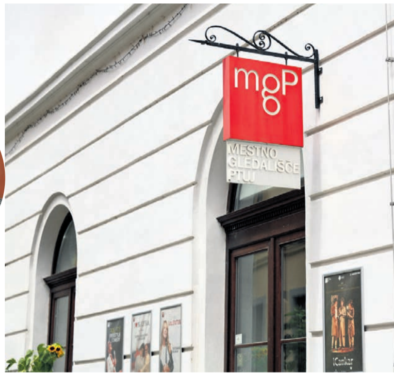
Srpčič je pred kratkim v našem časopisu problematiziral vzdrževanje gledališke stavbe, očitek je, da bi moral urediti ta problem.

Podlehnik • Več mladim družinam, manj ostane za investicije