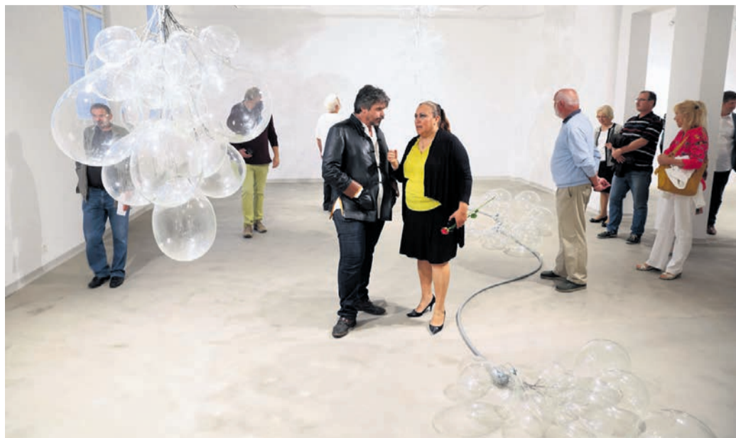
V Galeriji mesta Ptuj so na ogled steklene umetnine.