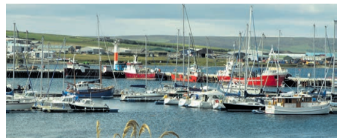
Kirkwall je postal priljubljeno pristanišče za križarke, kar je pripomoglo k blaginji mesta in razvoju trgovin z lokalnimi izdelki za turiste. (Kirkwall, Škotska)

Na odprti palubi se zbere gruča ljudi, ki jo privabi energična melodija. Množica na pomolu koraka proti velikanski ladji. Iz majhnih pikic se naslikajo moški v svoji značilni noši, ki ob igranju na dude pričarajo čudovito, a prav neobičajno slovo. Namesto Time to Say Goodbye, ki se po navadi razširja iz zvočnikov, je tokrat škotska melodija tista, ki nas ob sončnem zahodu popelje nazaj na širno morje. Otroci mahajo v pozdrav, ptice krožijo nad palubo in po licu mi spolzi solza sreče. Ja, delo na ladji se definitivno splača, pomislim, ko ljubi Škotski pomaham v pozdrav.