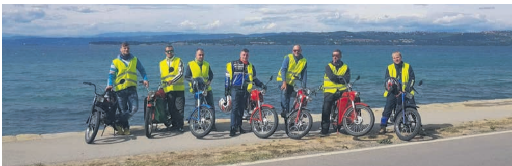
Na slovenski obali jih je pričakalo lepo vreme.