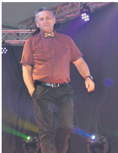
Največ aplavza je dobil moški del manekenske zasedbe.