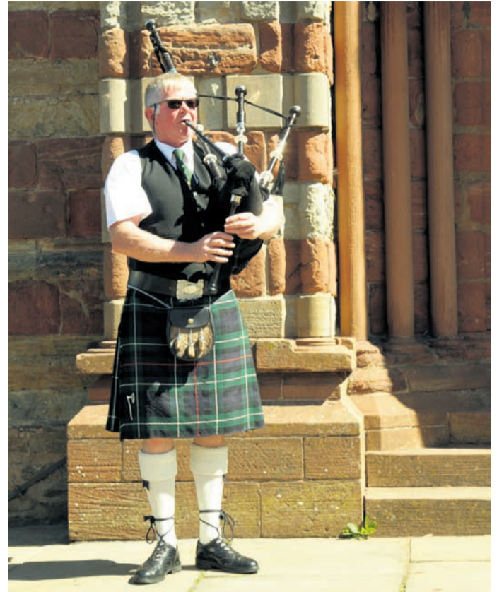
Moški v kiltu igra na dude, škotski tradicionalni inštrument. Kilt je moško krilo, del škotske narodne noše, ki je narejeno iz volnenega blaga, imenovanega tartan, in slovi po raznobarnih karirastih vzorcih. (Invergordon, Škotska)

»Dobrodošla na Škotskem!« se nasmehi zajetna gospa, ko mi pod nos pomoli pladenj z majhni kozarčki, za katere predvidevam, da so napolnjeni z alkoholno pijačo. »Viski?« se začudim, saj je ob tako zgodnji uri, ko ulice še niso poplavljene z ladijskimi turisti, ponudba dokaj nenavadna. »Ne, ne viski – to je škotski viski!« prepričljivo poudari. Lokalna trgovinica leži v središču deževnega Kirkwalla, največjega mesta otočja Orkney, ki leži na skrajnem severu Škotske. Napis pred barvito prodajalno vabi ladijske turiste na pokušino tradicionalne škotske pijače, ponuja pa tudi številne lokalne pridelke in avtohtone izdelke. A trgovina ni edina, pred nekaterimi restavracijami lastniki zraven plakata naše ladje, ki so ga verjetno natisnili s spleta, dopišje še lepa sporočila. Zdi se, da je za mestce z nekaj več kot devet tisoč prebivalci, dan, ko ga obišče križarka, skorajda praznik. Ker je na otoku izjemno malo avtomobilov, še strahu, da bi vas kdo povozil, če bi skrnili preveč viskija, skorajda ni.