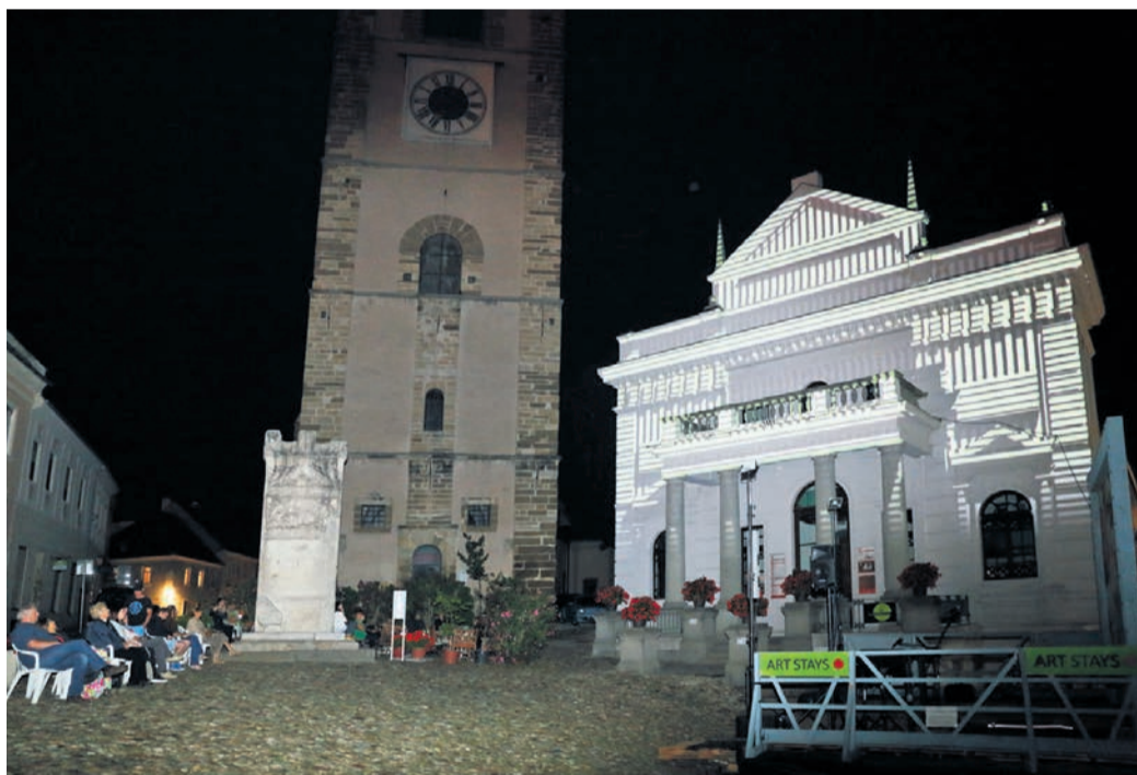
Videomapiiranje Mestnega gledališča italijanskega dua Movimento