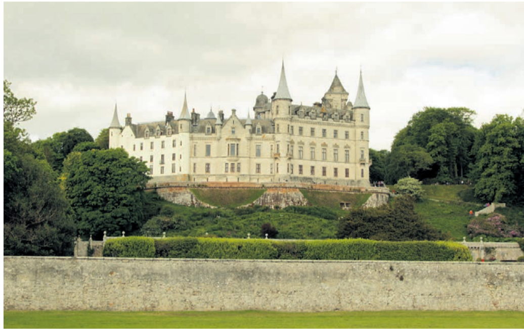
Pravljični grad Dunrobin, ki leži le nekaj deset milj od skrivnostnega jezera Loch Ness, velja za enega najlepših gradov na svetu. (Golspie, Škotska)

Škotska je ena od štirih držav, ki sestavljajo Združeno kraljestvo Velike Britanije in Severne Irske. Zavzema približno tretjino Britanskega otočja, k ozemlju pa spada še skoraj osemsto otokov, ki so posejani okoli države, od katerih jih je poseljenih le kakšnih sto trideset. Dežela šteje nekaj več kot pet milijonov prebivalcev, ki poleg angleščine govorijo še stari keltski jezik, škotsko gelsščino. Poleg značilne izgovarjave, slovnic in posebnih izrazov ima škotska angleščina izrazit, včasih celo težko razumljiv besednjak.