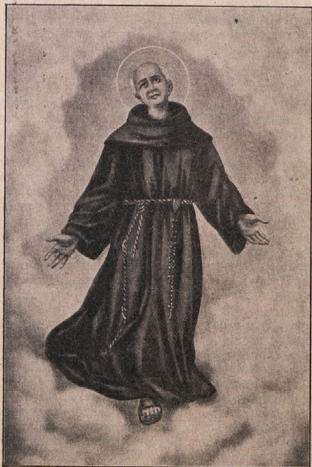
Sv. Teofil iz Korte v poveličanju.