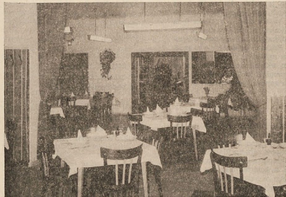
Pogled iz jedilnice v gostinsko sobo

o slavni preteklosti in številne cerkve o požrtvovalnosti tamkajšnjega ljudstva. Številne vode omogočajo ribolov. Iglasti in mešani gozdovi skrivajo jelene, srne in divje prašiče in seveda tudi gozane sadeže vseh vrst. Zato ni čuda, da pomenijo sprehodi skozi te gozdove resnični odih in razvedrilo za vsakega.