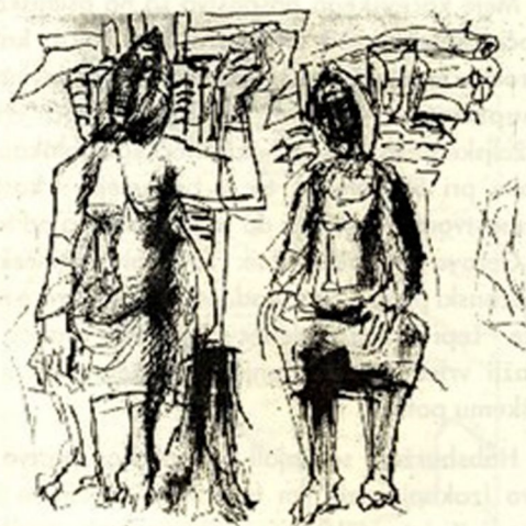
POČITEK POD KOŠEM