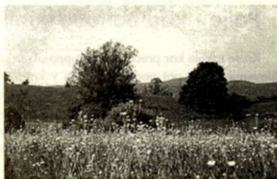
Pomlad v naši dolini