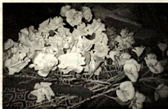
Ljudska umetnost - rože iz papirja

naredila novo cvetje. V Bosljivi Loki, na glavnem oltarju, boste videli nežno rožnat venec iz vrtnic, ki ga je pred kratkim naredila Danica. In na stranskih oltarjih prelepe rože v vazah. Tudi te rože - poročni šopki, venci in venčki so naša stara ljudska umetnost in zato ne smejo v pozabo. Jaz imam te rože zelo zelo rada.