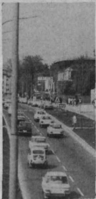
križišče in pa Titova cesta skozi Črnuče nevarni za voznike in za pešce.

Z denarjem iz presežka posojila za ceste naj bi zgradili oziroma preuredili križišče Titove in Nemške ceste in Titovo cesto skozi Črnuče, s pločnikom, za pešce in kolesarsko stezo ter semaforiziranimi križišči. Znano je, da sta prav to