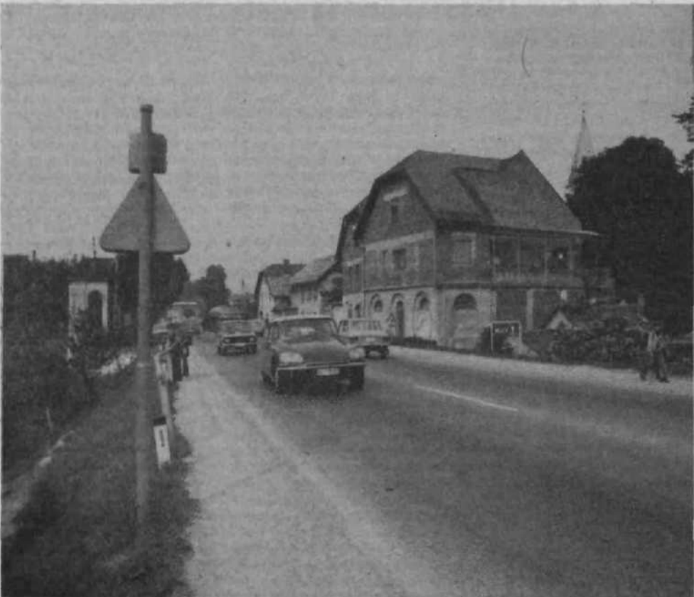
Za pešce je praktično vsak korak na črnuškem delu Titove ceste tveganje. Pločnika ni, nekateri so tvegali preveč...

Če se bo dinarju za ceste kaj bolje godilo v prihodnjem cestnem obdobju, se potemtaka tudi kaj prej lahko nadejamo dograditvi ljubljanske obvoznice, sicer pa – kot že rečeno. Zdaj je torej časa na pretek, da se kot občani – na osnovi načrtovane obvoznice – odločimo, ali nas začrtana trasa kaj moti ali ne in kaj nasploh mislimo o ljubljanskem cestnem vozlišču, ki ga vsak dan preizkušamo na lastni koži. Do 10. septembra je torej čas, da pridemo na dan s svojimi pomisliki, predlogi in dopolnili, kar zadeva predlagani načrt, medtem ko so finance in njihova moč časovno pač znanne – do leta 2000. J. O.