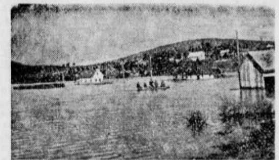
Del Kozaršč z šmarato

Glavno vodovlje prihaja od pobočja Snežiskega gorovja in iz vnožja Rane gore kot močan Obrh, ki takoj v pričetku goni mlino in