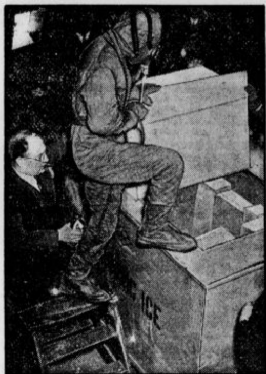
Ameriški raziskovalec Marc Ridge se pripravljata na nov polet v stratosfero. Stopil je v hladilno omaro, v kateri so znižali temperaturo zraka na 80 stopinj pod ničlo, v posebni obleki, da bi poskušal ali prenese tako strašen mráz.