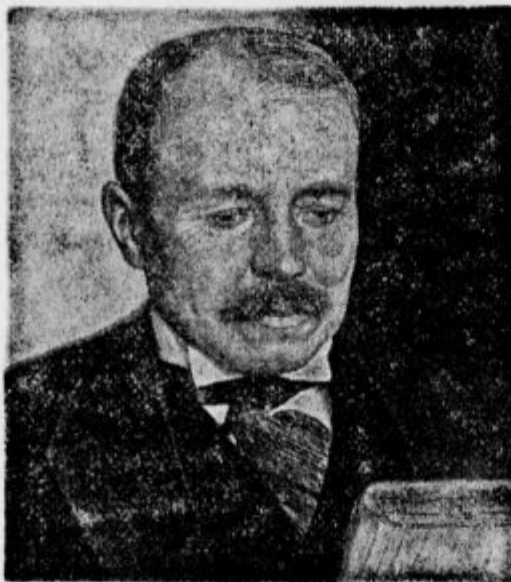
G. Musy, švicarski finančni minister, ki je odstopil in s svojo ostavko izzval hudo finančno krizo.

Tako zadene človeka usoda, ki je njegovemu stroju najbolj primerna in ki jo določajo dogodki. Mislim, da ne bi prav nič odločevala moja želja, kako bi zopet živel, ako bi začel znova življenjsko pot. Zato smatram vse recepte, kako lahko človek obogati, za prazen nič.