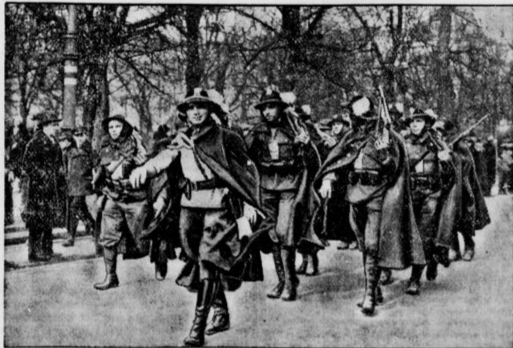
Rojstni dan maršala Piłsudskega so na Poljskem praznovali izredno slovesno. Iz južno-vzhodne Poljske je prispel oddelek vojaštva v slikoviti nošnji, da bi se poklonil maršalu pred gradom Belvedera.

»Čujte, natakari! V juhi je gumb! O, hvala lepa! Iščem ga že od včeraj!