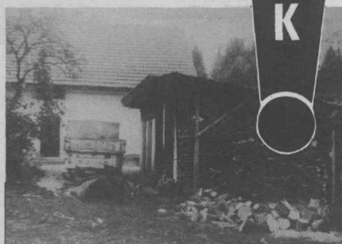
Pred nedavnim smo imeli člani KO ZB NOV Sostro-Podlipoglav v spomskem domu II. grupe odredov redno sejo. Bil pa sem krepko razočaran nad okolico doma. Za stavbo je sicer predvidena sanacija, toda leta najbrž ne bo odpravila navlake okoli hiše. Obupna je predvsem z zadnje strani. Na dvorišču stoji star zarjavel kombi, vse nakoži so razmetana drva in pločevina, drvavnice so iz raznih obdobij, zajčnice in odvržene stare pločevinke kaze okolico. Fotografija je bila posneta 17. oktobra.