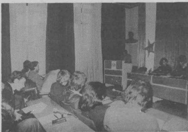
Delovni posnetek z izredne konference mladih

Z delom v osnovnih organizacijah je šlo počasi, a zanesljivo navzdol, področne konferencie niso prav zaživeli in tudi ne naše svoje vloge, tako da se je predsedstvo odločilo, da skliče izredno volilno programsko konferenco. Če lahko sodimo po ude-