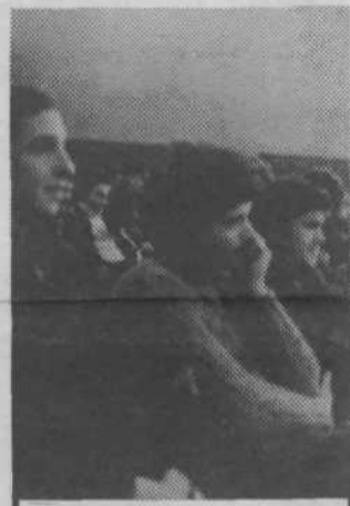
Občinska konferenca je pripravila, v sodelovanju s sekretariatom za narodno obrambo pri občinski skupščini, srečanje nabornikov-obveznikov. To srečanje naj bi postalo v prihodnje tradicionalno.

Na prvi seji predsedstva so se člani dogovorili za enodnevni delovni seminar, kjer naj bi pripravili in uskladili akcijske programe in rokovnike za delo komisij, klubov in področnih konferenc. Po-doben seminar naj bi bil tudi za vse predsednike osnovnih organizacij. IG