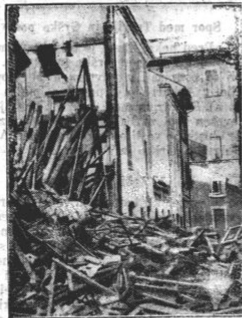
Podrte hiše v Senegalliji.

Sedaj pred novim letom, je najlepša prilika za pridobivanje novih naročnikov »Kmet. lista«. Vsak, ki jih bo pridobil vsaj 8 novih, bo prejemal list celo leto brezplačno!