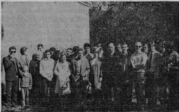
Člani kluba ob ogledu marijagraških fresk