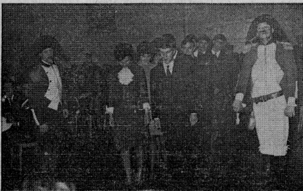
Brucovanje z lanskega akademskega plesa v Laškem