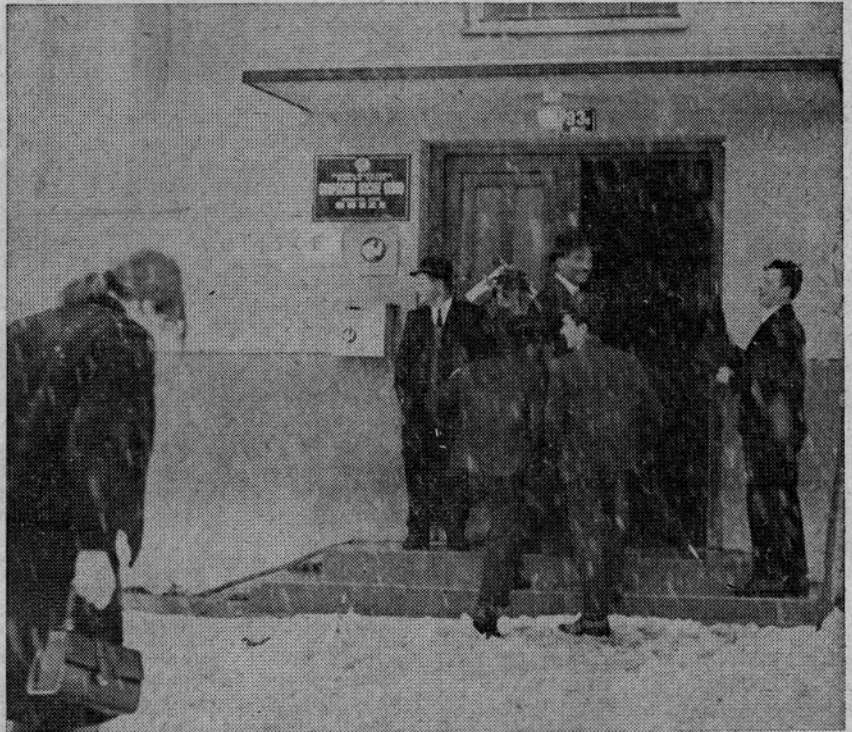
KLJUB SLABEMU VREMENU — SNEGU IN DEŽJU SO VOLIVCI TUDI NA BREZAH PRIHAJALI NA VOLIŠČE ŽE V ZGODNJIH JUTRANJIH URAH

se v marsikateri krajevni organizaciji SZDL oziroma sindikalni organizaciji ukvarjali predvsem z organizacijskimi in proceduralnimi pro-