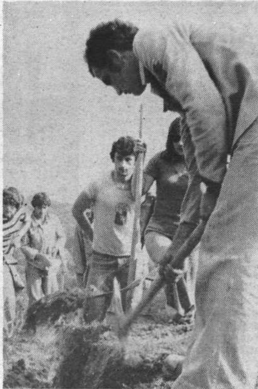
Brigade - kaže da bodo letos brigade v občini Center popolne, kar pomeni, da bo odšlo na delovne akcije toliko mladit, kolikor so predvidevali

Vse bolj so intenzivne tudi priprave na mladinske delovne akcije. Prva brigada bo odšla na delo 23. junija v Belo krajino. Glede na trenutno stanje prijavljenih brigadirjev ocenjujemo, da bodo naše brigade v letošnjem letu popolne ter tako tudi v celoti opravile načrtovano delo.