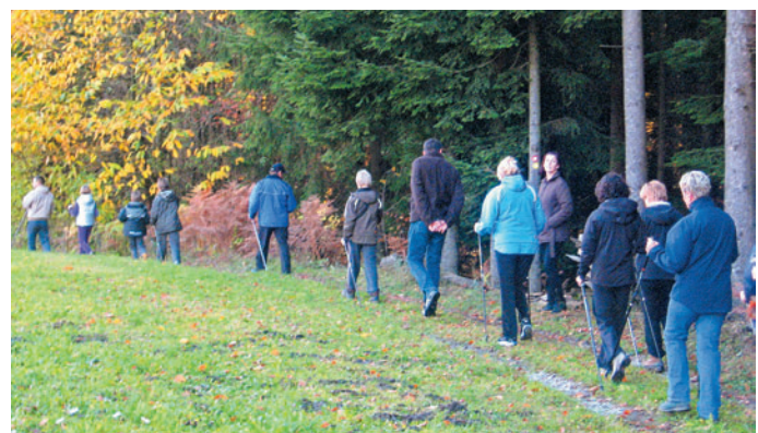
Goste Term Snovik so popeljali po pohodniških poteh proti Zg. Palovčam.