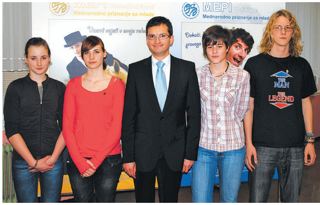
Župan Marjan Šarec je dijake ŠCRM spodbudil k nadaljnjemu udejstvovanju v projektu in s tem novim izzivom. Na sliki z nekaterimi od prejemnikov bronastih priznanj MEPI.

vlogo pri promociji Slovenije med mladimi v svetu, saj se s pomočjo mednarodnih povezav in odprav, ki jih Program MEPI ponuja na nadnacionalni ravni, širi prepoznavnost naše države. Koncept programa temelji na osebnem izživu. Cilj programa je razvoj samopodobe in družbenega zavedanja mladega človeka.