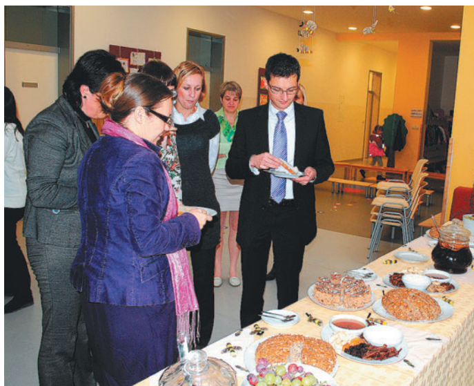
Župan Marjan Šarec s sodelavci in vodstvom vrta pri okusnem in zdravem medenem zajtrku.

Ker pa so dogodek v vrtcu združili s projektom Medkulturno povezovanje, se je zbranim pridružila študentka iz Indije, ki bo dober mesec preživela v Kamniku, otrokom pa v tem času predstavila indijsko kulturo in jezik. S projektom »Medkulturno povezovanje« želijo vzgajati najmlajše v znamenju tolerance in strpnosti do drugih, želijo jih seznaniti z drugimi kulturami in jeziki. Na kratkem dogodku je bila v ospredju slovenska narodna noša in pesem.