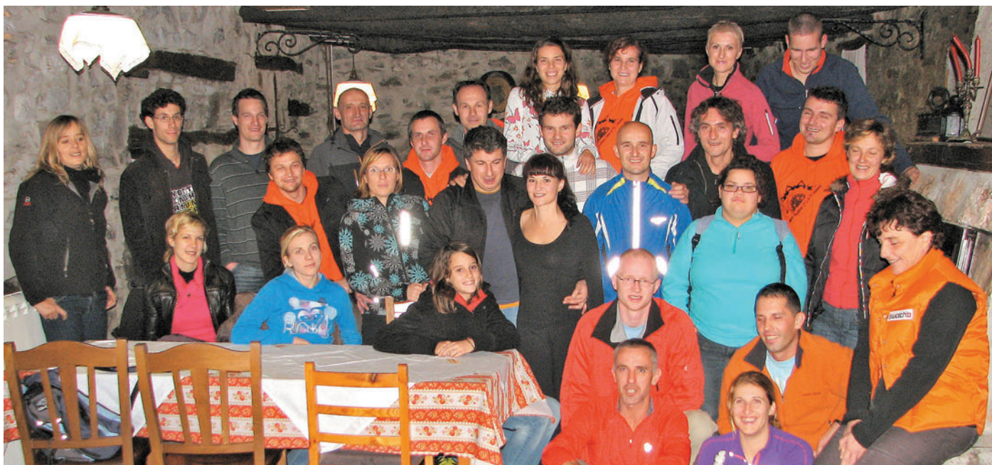
Po končani polovički smo krstili štiri naše tekače, ki so se z razdaljo spopadli prvič.

Planinsko društvo Kamnik tudi letos nadaljuje s prakso odprtja koč na Kamniškem sedlu ob lepih koncih tedna. Res pa je, da je oskrbovana samo zasolino - v njej se je mogoče pogreti, popiti čaj, pivo, medtem ko hrane ni možno kupiti. Kadar je vreme slabo ali razmere niso ugodne, pa je kočja zaprta. To je napisano na tabli pri Domu v Kamniški Bistrici. Napis postavi oskrbnik, ko gre gor in ga odstrani, ko se vrne. Zato se lahko zgodi, da bo kdo našel kočjo zaprto, če bo prišel do nje pred oskrbnikom ali pa po tem, ko je le-ta že odšel. Za take primere je namenjena zimska soba, ki je stalno odprta in v kateri lahko poiščemo zavetje pred vetrom in slabim vremenom.