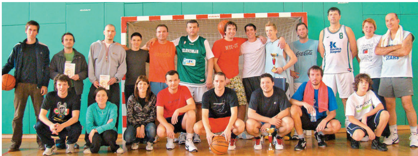
Najboljše košarkarske ekipe in člani Leo kluba Kamnik.