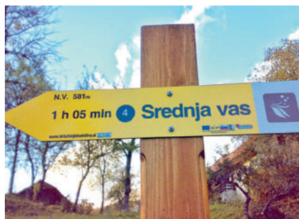
Po poti do cilja pohodnike usmerjajo lične oznake.

Turistično društvo Tuhinjska dolina je ob sofinanciranju evropskih sredstev letos uspešno izpeljal projekt Stare pešpoti v Tuhinjski dolini, v sklopu katerega so uredili in oživili osem starih pohodniških poti v skupni dolžini preko 80 kilometrov, jih označili po najnovejših standardih in izdali karto poti z zemljevidi in opisi poti in zname-