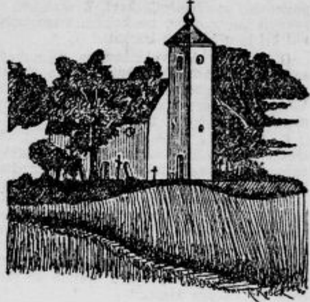
Cerkvica pri Dolnji Lendavi

Katoliška cerkev v Dolnji Lendavi ni nič posebnega in bi pričakovali pri ta- ko pobožnem ljudstvu, kakor je prekmur- sko, lepše in prostornejše zgradbe. Pač pa je jako idilična na najvišjem vrhu Dolnje lendavskih goric stoječa kape-