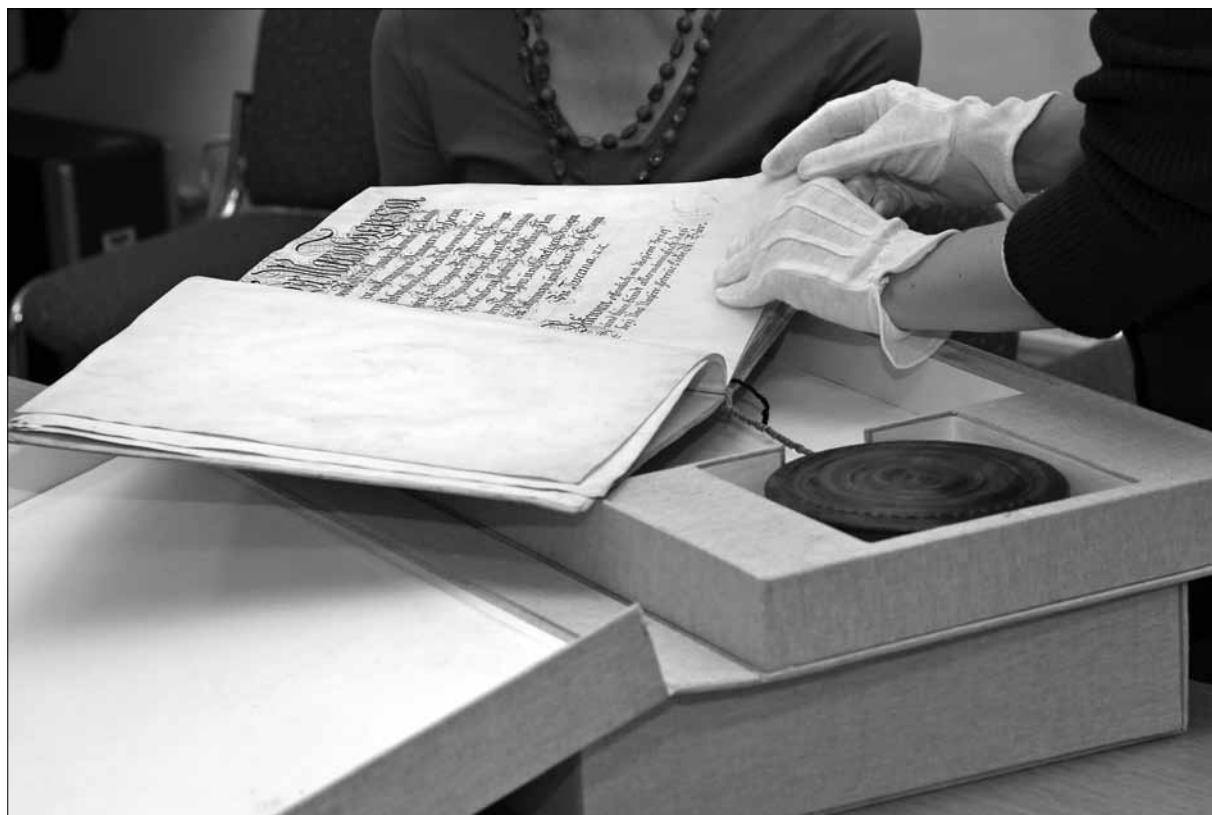
Aktivnosti za odrasle ob mednarodnem dnevu arhivov v Zgodovinskem arhivu Ljubljana, 7. junij 2013 (predstavitve listine iz leta 1747 o ustanovitvi zastavljalnice v Ljubljani) (foto: Tina Arb, ZAL).