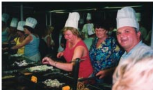
BBQ sredi puščavske Avstralije.

Zvečer smo si ogledali še prihod najmanjših pingvinov na svetu, ki so se vračali z lova in so prinašali hrano za mladiče. Da si boste lažje