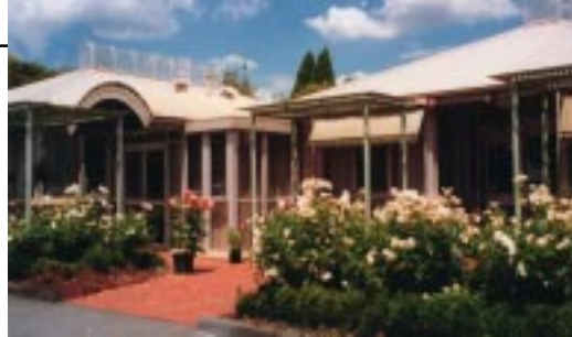
MOTHER ROMANA HOME Slovenian Hostel for the Aged Phone: 03 9853 1054 Fax: 03 9855 0811

Dom počitka matere Romane je slovenska ustanova, ki nudi bivanje v domačem okolju ostarelim in vsem, ki potrebujejo nego. Prijazna in topla soba, domača hrana, vesela družba, popolna zdravniška nega in celotna oskrba je samo del tega, kar boste našli v domu počitka le 20 metrov od slovenske cerkve v Kew.