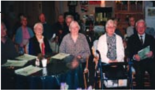
DOM POČITKA MATERE ROMANE Slovenski dom za ostarele 11-15 A'Beckett Street KEW VIC 3101