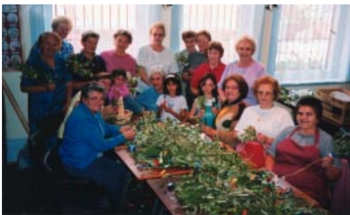
Pletenje butaric na cvetno soboto 2003.

PROJECT COMPASSION nas je v postnem času vabil k delom solidarnosti z ubogimi. Vse, ki ste sodelovali pri tem, vabimo, da oddaste svoje prihranke, da jih odpošljemo.