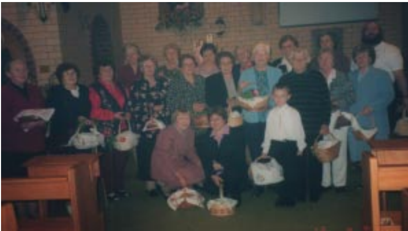
Po blagoslovu velikonočnih jedil v cerkvi Svete, Družine.

Po končani vigiliji je bila vstajenska procesija s petjem in svečami okoli cerkve. Po končanih obredih pa je mogočno zadonela iz grl vseh zbranih zahvalna pesem ob velikem prazniku Kristusovega vstajenja.