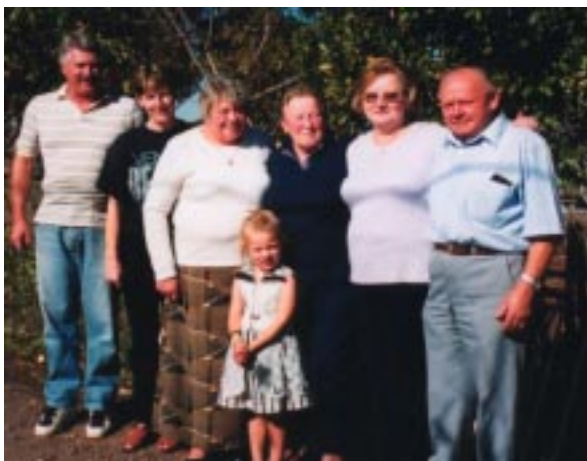
Ekipa, ki je gostoljubno postregla romarje.

Po ustaljenem razporedu je bilo v cvetnem tednu spovedovanje v Geelongu, Altoni North, Springvalu in St. Albansu. Povsod je bil predvideni čas napolnjen z delom.