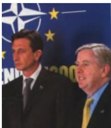
Predsednik evropskega parlamenta Pat Cox je prišel v Slovenijo ob koncu referendumu za vstop v Evropsko zvezo na povabilo predsednika slovenskega parlamenta Boruta Pahorja (levo).