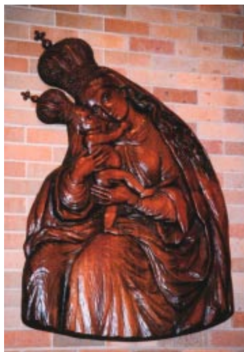
Lesorez Marije Pomagaj v Sydneyu.