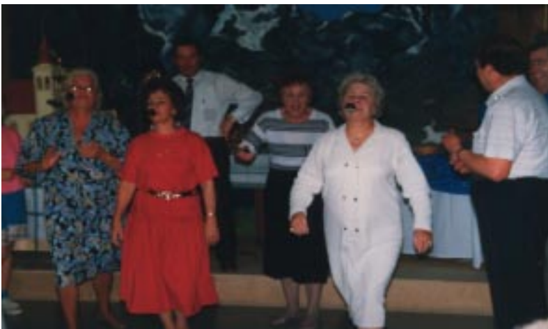
Veselo na pirhovanju.