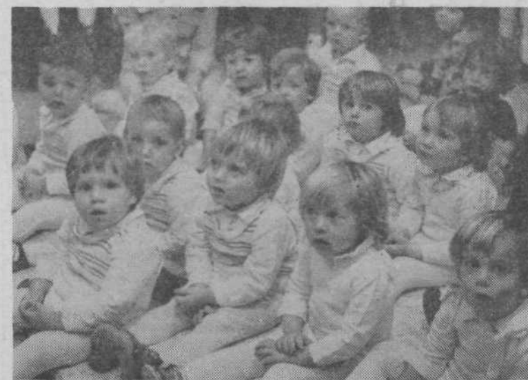
Maičkom je v našem vrtcu lepo