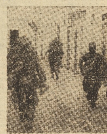
Poulični boji v Severni Afriki

še vedno divjajo boji in tudi atentati in veliko manj. Vse kaže, da se Maroko ne bo pomiril, dokler ne bo popolnoma neodvisen in dokler ne bo maroško ljudstvo samo upravljalo svojo domovino ter preprečilo delovanje sovražnikom maroške neodvisnosti.