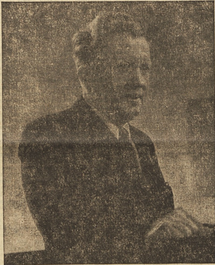
Tovariš Miha Marinko predsednik Glavnega odbora Socialistične zveze Slovenije