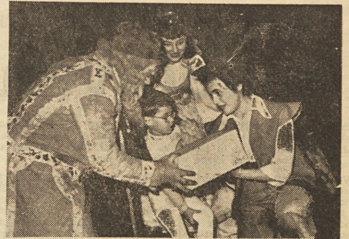
Tudi letos bo dedek Mraz obdaril naše najmlajše

Te slabosti, ki nam prinašajo ogromno gospodarsko škodo, pa lahko v znatni meri odpravimo sami. Če bi potrošniki ne kupovali pokvarjenih živil in če bi na to dosledno opozarjali naša podjetja, bi se tudi brez obsežnih investicij pokvarilo znatno manj živil. Dokončno izboljšanje pa lahko pričakujemo z urejenimi skladišči, smotrnim prevozom in doslednim upoštevanjem navodil, ki jih izdaja Centralni higienski zavod in tudi naši zdravniki.