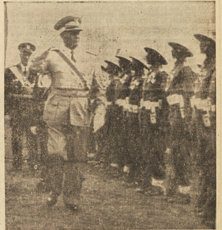
Sprejem tovariša Tita v Adis Abebi, glavnem mestu prijateljske Etiopije