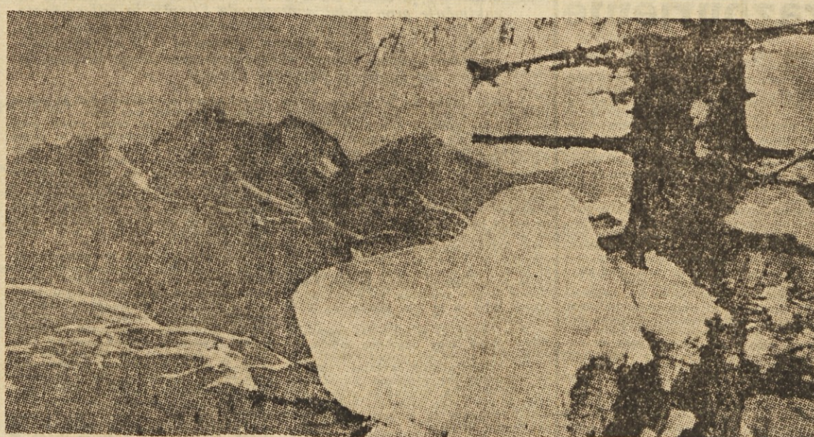
Zapadel je prvi sneg

Jugoslavija utira s tem obiskom pot novi dobi o odnosih med Evropo in Afriko, neodvisno, prebujeno Afriko. Nadaljnje poglabljanje prijateljskih odnosov med Jugoslavijo in Etiopijo bo pomagalo krepiti svetovne težnje po čim tesnejšem zblizevanju vseh dežel, ne glede na celine, družbene ureditve in različne stopnje razvoja. Zato ves napredni svet z zanimanjem in simpatijami spremlja obisk tovariša Tita v prijateljski Etiopiji. Zato tudi v teh dneh toliko pišejo o ogromnem ugledu, ki ga Jugoslavija uživa in o njenem velikem mednarodnem pomenu.