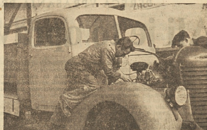
Tovarna avtomobilov v Mariboru izdeluje kamione in avtobuse na principu kooperacije. Kamion ali avtobus sam je sestavljen iz 2500 delov. Kolektiv Tovarne avtomobilov izdeluje sam 2089 delov, v 103 naših industrijskih podjetjih pa izdelujejo 387 sestavnih delov za kamione in avtobuse Tovarne avtomobilov v Mariboru. Samo 15 delov še uvažamo. — Na takšnem načelu bi lahko organizirali proizvodnjo v številnih podjetjih. — Izgovor, da je zamotanejšje proizvede težko izdelovati v kooperaciji, ne drži, saj je izdelovanje avtomobilov nedvomno zelo zamotano delo in vendar kolektiv Tovarne avtomobilov žanje že velike delovne uspehe.

Gre za to-le: Vodstvo podjetja »Saturnus«, tovarne kovinske embalaže v Ljubljani, je slučajno zvedelo, da je pri Oddelku za ekonomsko pomoč pri Generalni direkciji Narodne banke in Zveznem izvršnem svetu na razpolago 45.000 funt-sterlingov in sicer za nakup avtomatske linije (strojev) za izdelavo embalaže. Podjetje je ob tej no-