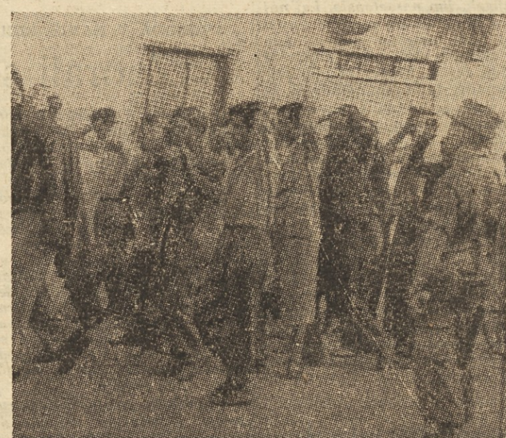
Francoska racija v Medini pri Casablanci

O Gaitskellu govore kot o človeku, ki bo prinesel v stranko »novega duha«.