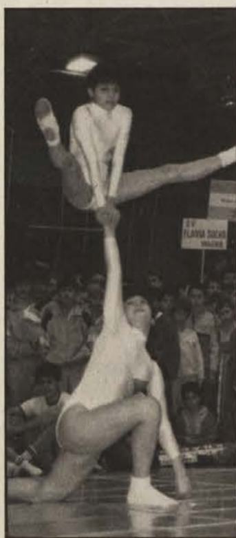
Navdušili: mladi akrobati