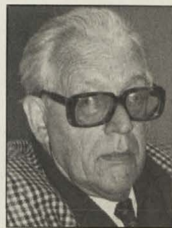
Avtor dr. Erwin Ringel

V tem smislu se v njegovi esejični razpravi kar naprej prepletajo temu ustrezni citati in primeri, ki nakazujejo potrebo po razumevanju stvarnosti in družbe ob poznavanju duhovnih dosežkov naravoslovnih znanosti, zgodovine, družbene kritike in umetnosti. Brez dvoma čtivo Erwina Ringla v 'Koroški duši' (tekst je aktualizirana verzija njegovega predavanja 15. septembra 1985 v Hodišah, kjer ga je poslušalo okrog 1200 ljudi) ni in tudi ne more biti vseobsežna resnica ali celo obvezna veroizpoved – tudi ne v smislu kritičnega odnosa do Koroške in njene stvarnosti. Marsikatera faseta te stvarnosti ostane neobdelana, neomenjena in tudi marsikatera interpretacija, ki jo ponuja Ringel, ostaja