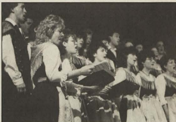
Na novoletnem koncertu je pel tudi MPZ „Danica“.