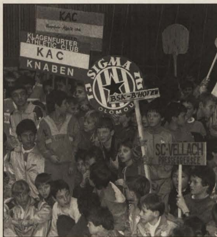
Vkorakanje moštev: izreden dogodek