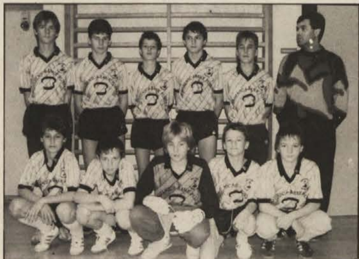
Izpadli proti ekipi Züricha: šolarji SAK