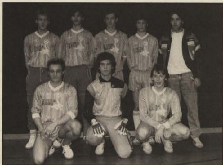
Uveljavili so se v vrhu: juniorji SAK

nastopajočih je poplačala vse, ki so morali za organizacijo turnirja vložiti veliko truda. Tako se je turnir najboljših ekip iz ČSSR, Anglije, ZRN, Bolgarije, Avstrije, Jugoslavije in Danske vtisnil vsem ljubiteljem nogometa v spomin, tako da je bilo iz vrst nastopajočih in gledalcev slišati le eno željo: Na svidenje leta 1990! Vsi pa si tudi naslednje leto želijo spet tako veliko in kvaliteten prireditev, na kateri so v otvoritvenem delu nastopili izredno izurjeni mladi bolgarski akrobati iz Plevna. Koroška karate zveza pa je z demonstrativnim nastopom prikazala svojo dejavnost.