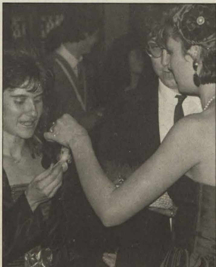
Ob prihodu na ples so vse ženske prejele nekaj sladkega.