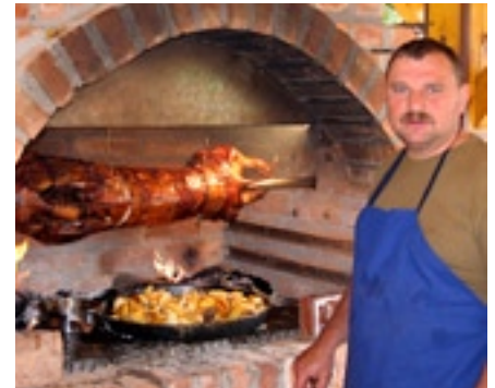
Pogostitev za najmočnejše