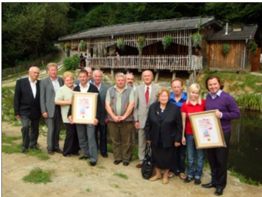
V dolini Winettu