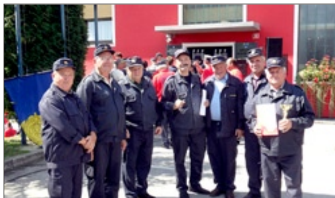
Prvič na tekmovanju v kategoriji starejših gasilcev, starejši člani PGD Stoperce

Vsi sodelujoči so pokazali zavidljivo operativno zanje ter poznavanje gasilsko športnih disciplin. Prva mesta so dosegli: Pionirji PGD Ptuj-ska Gora, mladinci, članice