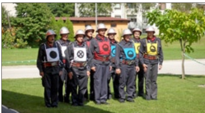
Člani B-PGD Majšperk - gonilna sila društva