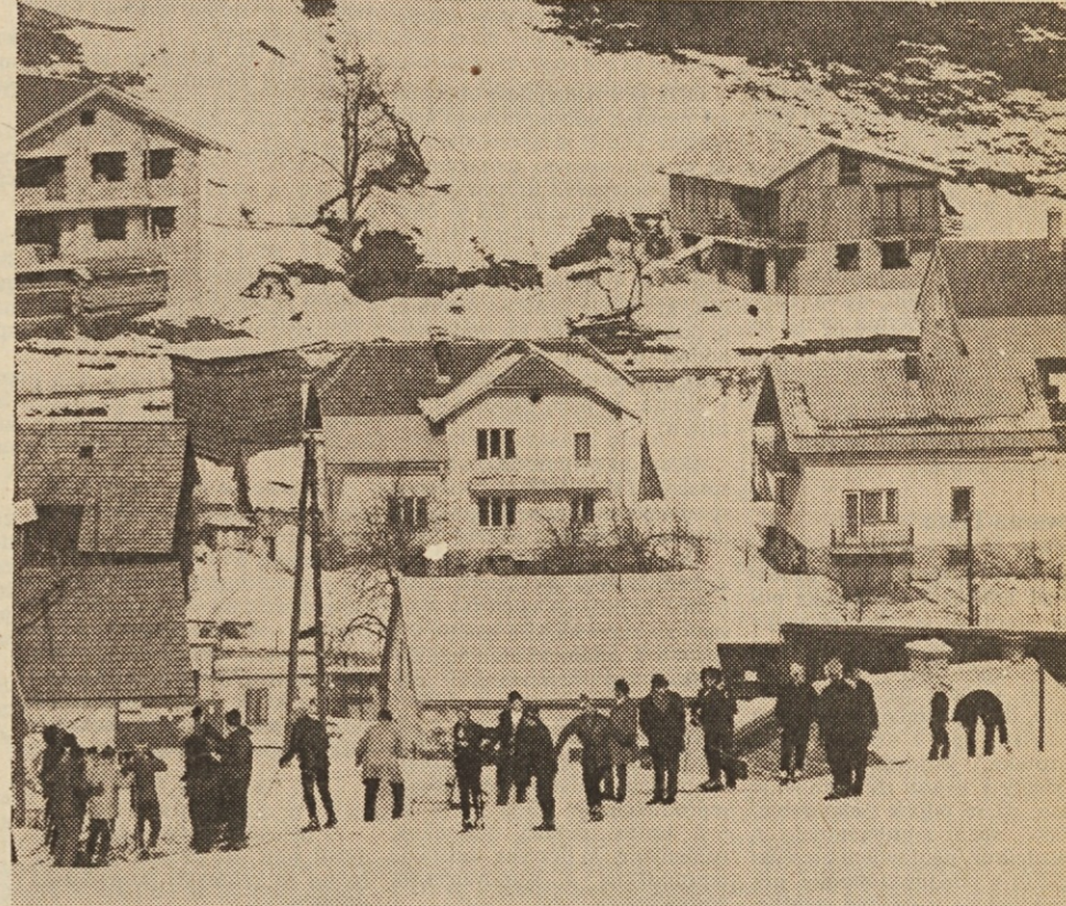
Okolica cilja na izbirnih tekmah smučarjev IMP v Črni