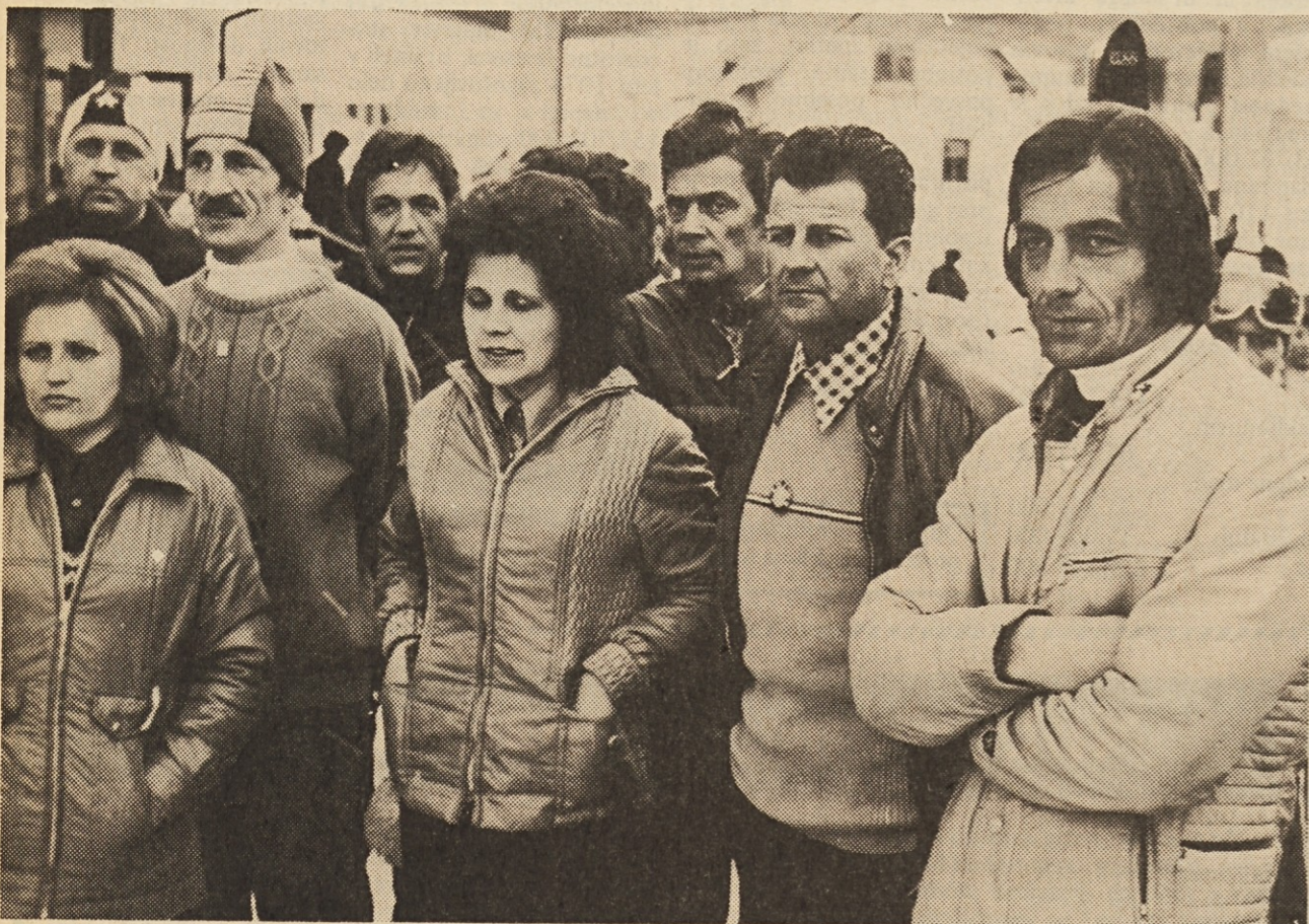
Del naše ekipe na ŠIG

Naši smučarji so letošnjo sezono sodelovali še na vrsti drugih prireditvah, ki so poleg izbirnih tekem v Črni služile za pregled kvalitete in sestavo najboljših ekip na ŠIG. Izredno dobro so naši smučarji vozili na občinskih tek-