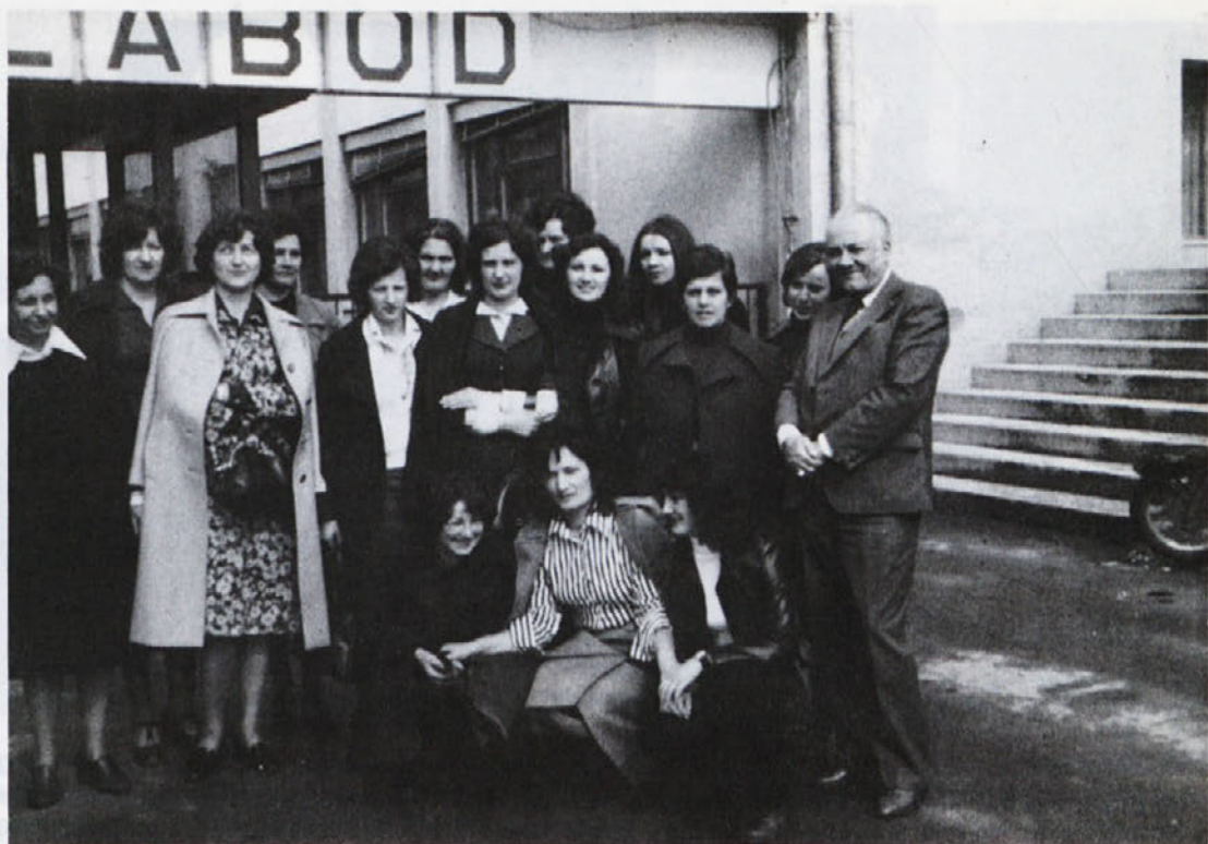
Nasmejane in zadovoljne so bile naše delavke, ki so uspešno končale poklicno šolo oblačilne stroke. Na sliki: slušateljice s predavateljema in mentorico te šole pred vhodom v tovarno.

Ni bilo lahko hoditi ob sobotah in celo ob nedeljah na predavanja, žrtvovati ves svoj prosti čas za učenje, včasih kar pozno v noč. In potem še živčna napetost pred izpiti, ki jih je bi-