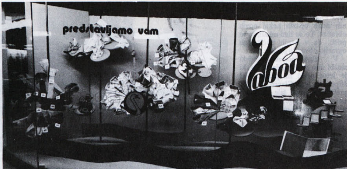
V blagovni hiši „Rijeka“ na Reki so od 15. – 21. 6. letos organizirali teden Laboda. Da so se res potrudili in skušali našo delovno organizacijo kar najbolj približati kupcu, dokazuje slika. Tako je bilo urejen izložbeni prostor.

Drugo srečanje organizator-jev obveščanja bo takoj po po-čitnicah, o tem dogovoru in stališčih bomo tudi poročali.