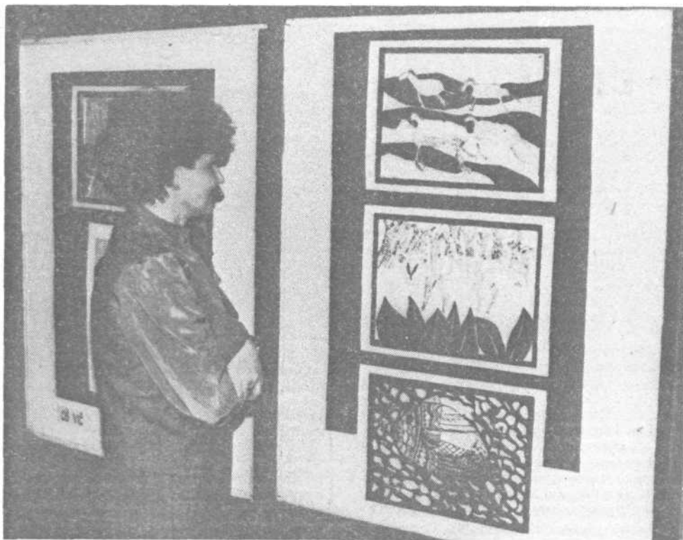
Z RAZSTAVE UČENCEV V OSNOVNI ŠOLI NA VIČU