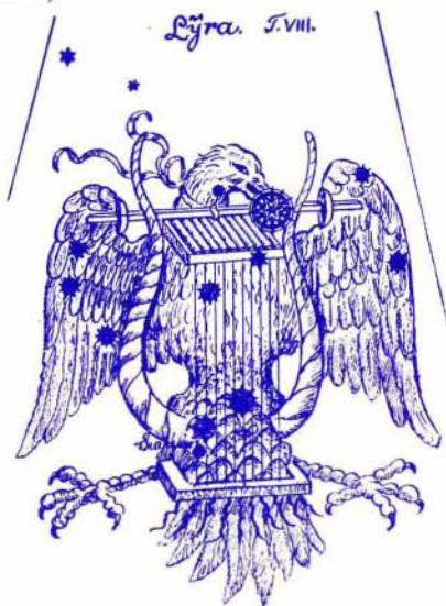
Slika 3. Podoba ozvezdja Lira iz starejšega zvezdnega atlasa (17. stol.). Stara ljudstva so v tem ozvezdju videla tudi jastriba. Arabci so Vega imenovali An'Nasr al'Vaki – Padajoči orel. Iz zadnjega dela te besede je nastalo ime Vega. Epsilon Lire leži v vratu tega orla.

Predlagam, da se jasnega poletnega večera odpravite v odmaknjen in miren kraj s čim manj svetlobe, se sprostite, umirite, zlezete v spalno vrečo, se udobno uležete v travo ali na klop in opazujete zvezdo Epsilon Lire . Z lovskim daljnogledom jo vidimo kot širok par šibkih zvezd, raz-