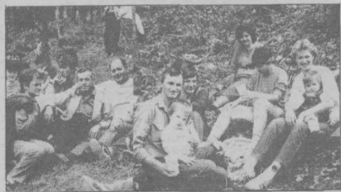
Nekaterim je dano, da se prvomajskega Pečarja že malih nog udeležijo. Kdo ve, kako bo čez 20 in več let, ko bodo oni stariši

Ne samo kmetovalci in vrtničkarji, prav vsi želimo v aprilu in maju veliko sonca, da se pomlad razcveti v vsem razkošju in da čimprej pozabimo tegobe zime.