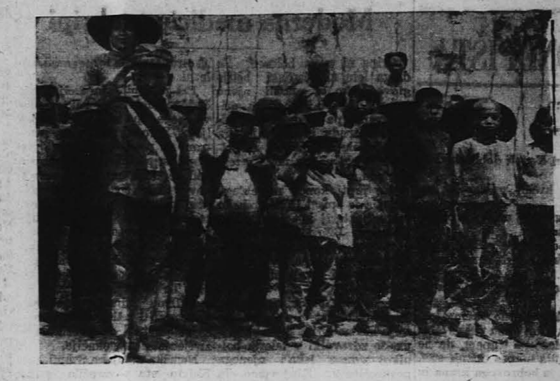
Skupina mladih Hsiao Pao (malih vragov), ki kot prostovoljci pomagajo v bombardiranih krajih gasiti požare in reševati ljudi.

V Mezopotamiji so našli risbe o asirskih utrdbah, ki so stare okrog 4000 let. Te utrdbne zelo spominjajo na srednjeveške obrambne naprave v Evropi. Če jih gledamo od sovražnikove strani, obstojajo iz treh nasipov, ki se dvigajo drug nad drugim in segajo prav do novejnosti mesta ali naselja. Zunanji najnižji nasip obstoja iz zemeljskih okepov, srednji in zadnji pa sta zgrajena iz zopke na strmih skalnatih grebenih. Okopi so ojačeni s stolpi in kazematami. Takšne so bile asirske utrdbne približno pol-druge tisočletje pred Kristosom.