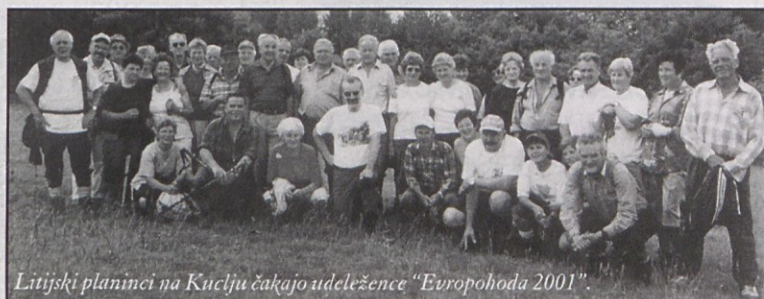
Litijski planinci na Kučlju čakajo udeležence »Evropohoda 2001«