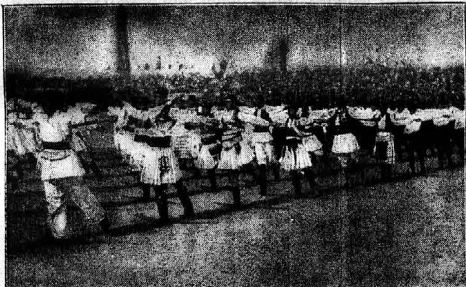
Vežbe naših sokolskih četa na praškom sletu

Naravno da i naša država nije mogla biti neki izuzetak, pa je i naša zahvatila opća privredna depresija i