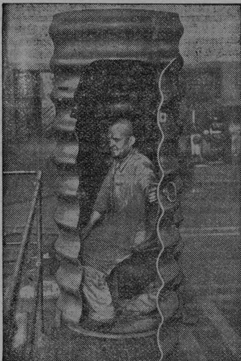
Zaklonišče proti letalskim bombam za posameznike v Berlinu

tako da so mogle vse ladje svobodno in neovirano pluti iz Egejskega morja v Marmarsko in skozi Bospor v Črno morje ter obratno. Izvajanje določb te konference bi morale jamčiti Italija, Anglija, Francija in Japonska z vso svojo oboroženo silo.