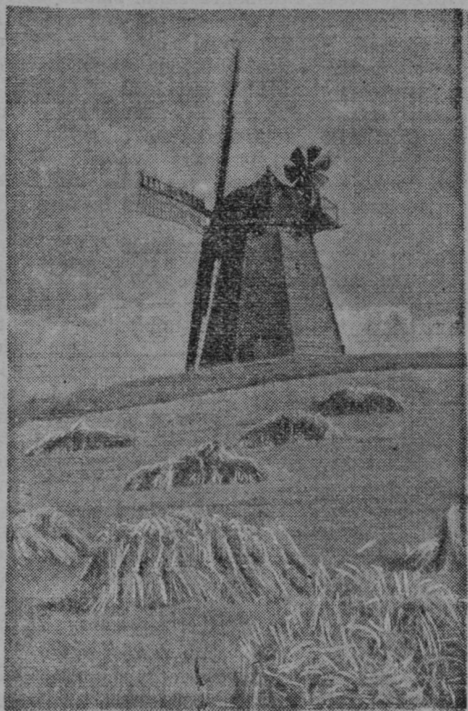
Holandska pokrajina v jeseni z mlinom na veter