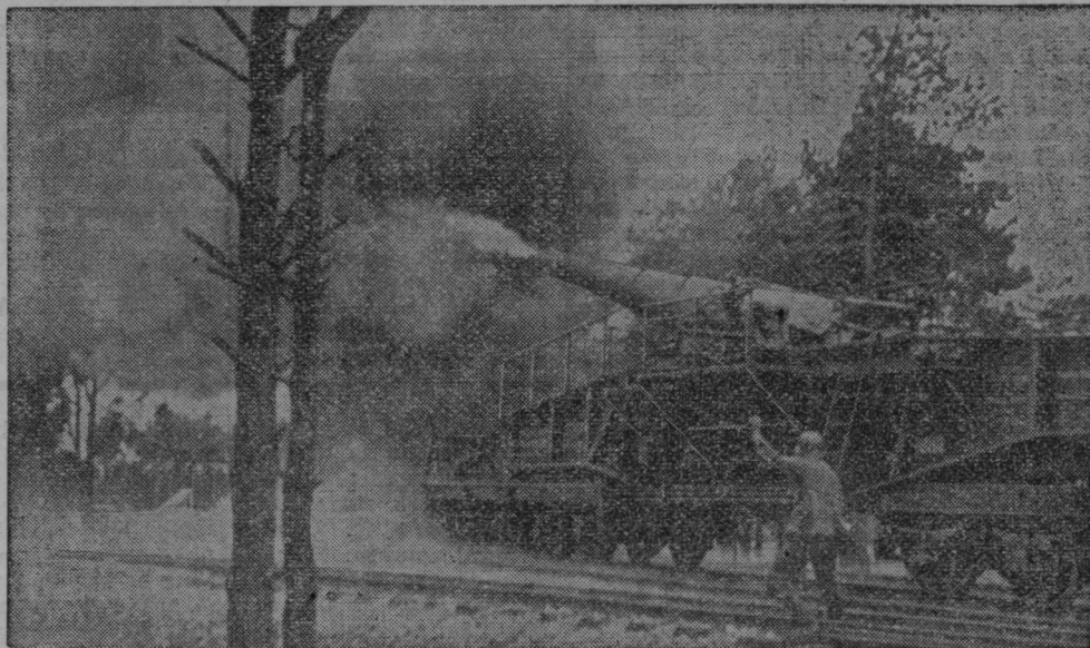
Nemški daljnostrelni top, s kakršnimi obstreljujejo Nemci s francoske obale južno angleško obalo