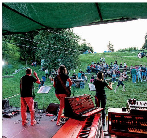
Nekaj utrinkov z letošnjega Liwkstocka