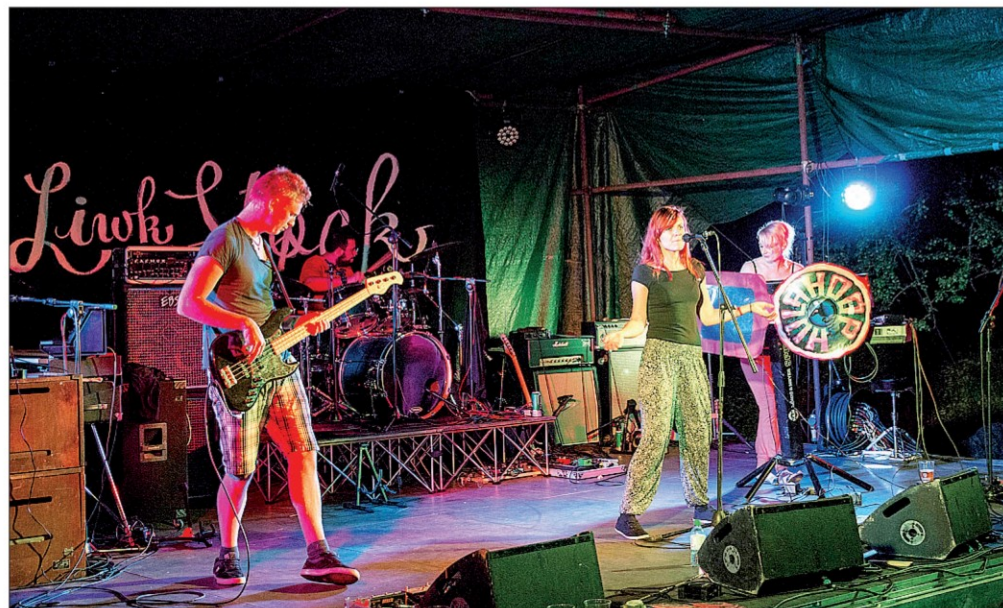
Skupina Hulahoop na odru festivala Liwkstock

Uspešen festival Liwkstock, odbojka an glasba z obeh strani meje