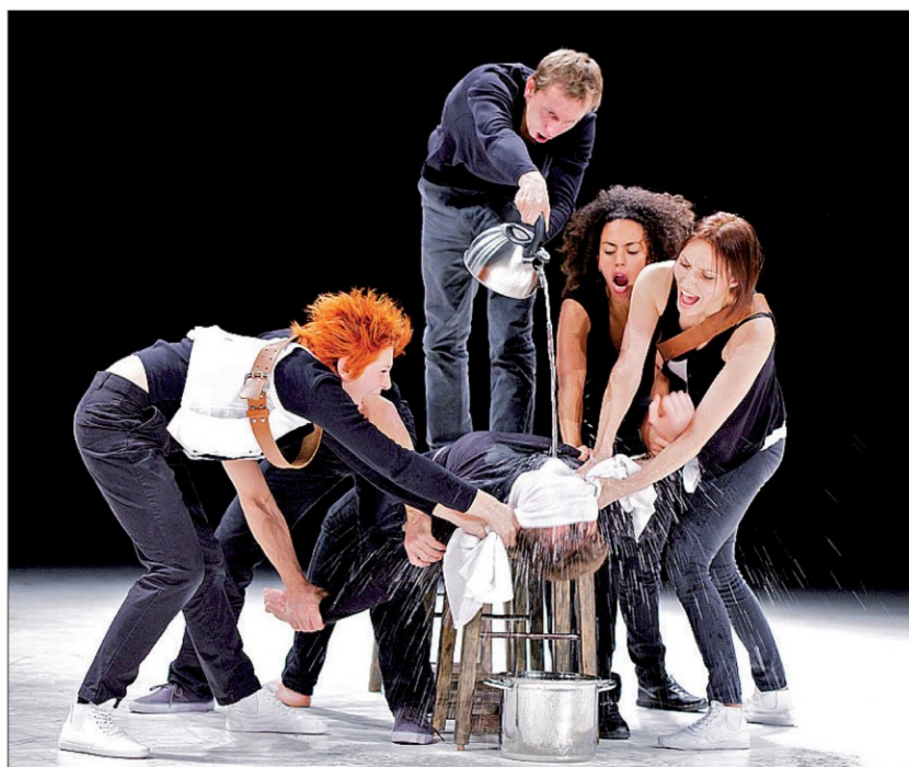
'Trash cuisine', predstava iz Belorusije