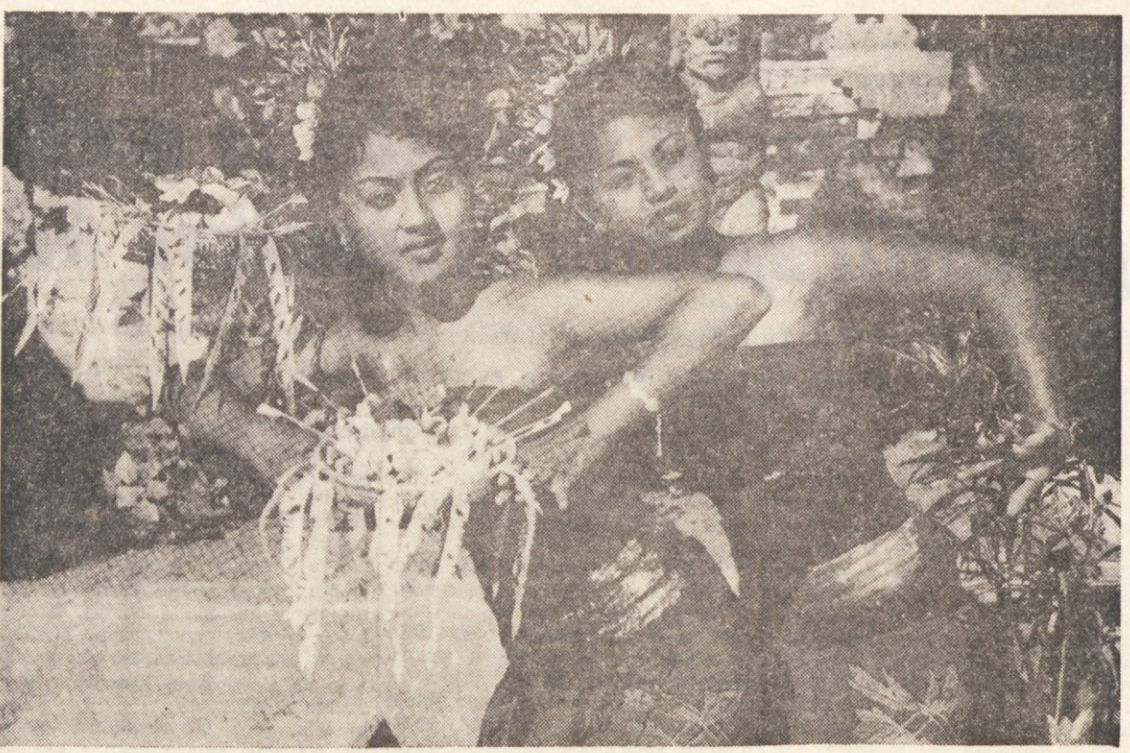
Na Tahitijskih sprejemih tuje turiste lepa domača dekleta s folklornimi pesmi in v nekakšnih narodnih nošah. Toda vse je tako stilizirano, da nima več nobene zveze z resničnim starim folklornim bogastvom

OVEN (od 21.3. do 20.4.) Ne boste klonili spriču kritik. Skrbno varujte neko svojo skrivnost. BIK (od 21.4. do 20.5.) Odpravite napetost, ki vlada med vami in sodelavci. Pomagali boste rešiti družinski spor. DVOJČKA (od 21.5. do 21.6.) Rešite nekatera upravna vprašanja. Glede čustvenega vprašanja se ravnajte po prvem vtisu. RAK (od 22.6. do 22.7.) Če imate poslovni čut, dokažite to predvsem svojemu predstojniku. Vsi vaši nasveti bodo sprejeti. LEV (od 23.7. do 22.8.) Z neko bistveno spremembo se bo spremenil tudi način dela. V družini mir in zaupanje. DEVICA (od 23.8. do 22.9.) Zanesite se na trdno voljo in sprejmite neko ne lahko nalogo. Našli boste svoj mir.