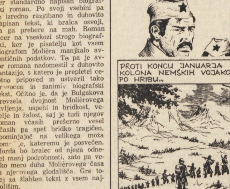
PROTI KONCU JANUARJA 1943. LETA SE JE KOLONA NEMŠKI VOJAKOV VZPENJALA PO HRIBU...