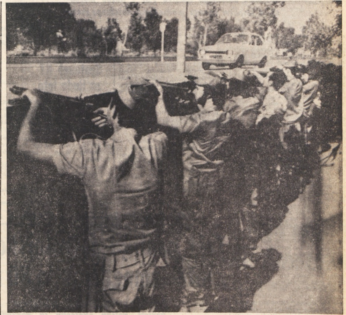
Turški vojniki v bližini Kyrenie v poznih večernih urah 20. julija, prvi dan, ko so se izkrcali na Cipru