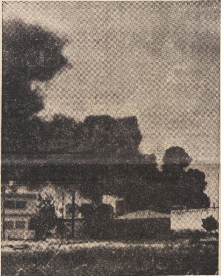
Gost oblak dima se dviga nad ciprskim mestom Kyrenio, kjer so se turške čete najprej izkrcale

Radio Ankara je danes poročal o domnevnem državnem udaru v Grčiji, ki naj bi strmo glavo sedanjega predsednika republike generala Giziakisa. Državni udar naj bi izvedel tretji armadni korpus, ki naj bi se uprl v Solunu. Iz Aten poročajo, da je položaj, če izvažemo splošno mobilizacijo in operacije v zvezi s ciprsko krizo, popolnoma normalen. Nam omenimo, da je turški radio že v prejšnjih dneh večkrat poročal o odstopu sedanjega grške vlade ter o številnih državnih udarih, ki naj bi strmo glavo polkovniški režim.