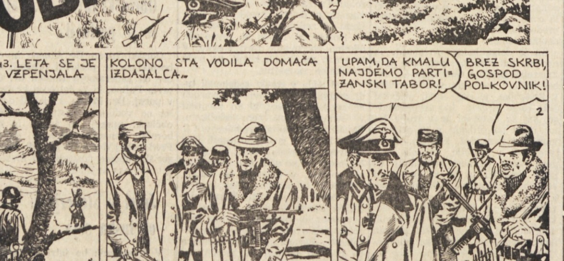
UPAM, DA KMALU NAJDEMO PARTIZANSKI TABOR! BREZ SKRBI, GOSPOD POLKOVNIK!