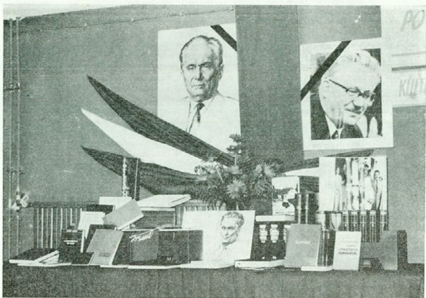
Razstava del Tito — Kardelj

Posrečilo se je dati razstavi tisti zunanji izraz, ki ga je že po svoji tehni vsebini in po vrhunskih avtorjih zaslužila. Kreirana je bila s tovrstnim znanjem, bila pregledna in v svoji razumljivi majhnosti pristrčna. Razstavo je omogočila knjigarna Mladinska knjiga iz Celja, ki je s tem pametno pokazala pot do nakupa razstavljenih knjig. Razstava je našla svoje mesto v prostori