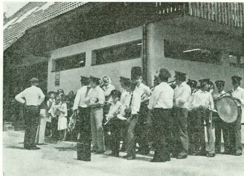
Svečanosti je dala poseben poudarek tudi Svetinska godba na pihala

Ob 20. juliju — prazniku občine Celje in 22. juliju — Dnevu vstaje slovenskega naroda smo se zbrali na Svetini, da proslavimo novo delovno zmago s tem, da predajamo svojemu namenu družbeno poslovni center s samopostrežno trgovino in bifejem.