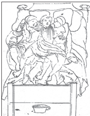
Duhovnik z dvema ženskama v postelji: pomanjkanje seksualne morale številnih duhovnikov je bila zanimiva tema tudi za umetnike; perorisba, Vigil Raber, okrog 1520/30.

Cesar Sigismund je sicer na koncilih v Konstanci in Bazlu predlagal ukinitve celibata, vendar mu to ni uspelo. Ta ukrep bi po vsej verjetnosti pripomogel k dvigu ugleda priležnic. Te so bile pogosto izpostavljene zaničevanju in posmehu prebivalstva. 154 To pa glede na Santoninovo pisanje, da ima »večina duhovnikov gospodinje, in sicer mlade in zale, te pa imajo še dekle. In vendar se ljudje nad tem ne spotikajo, zakaj malodane povsod jih častijo,