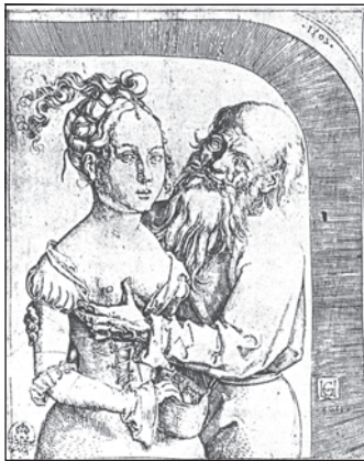
Neenak par, Hans Baldung Grien, 1507.