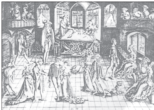
Ples je bil zabava v prostem času plemičev.