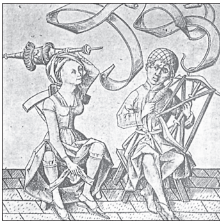
Podjarmljen mož: Israhel van Meckenem, okrog 1480/1490.

Uporaba fizične sile ni bila tipična za ženske, ampak so večkrat posegle po jezikanju, ignoriranju moževih ukazov ali jih na skrivaj niso ubogale. 116 Kako pa je družba, tudi same ženske, gledala na takšne »izkrivljenke«, nam je lepo razvidno iz Christininega komentarja.