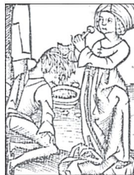
Ženska kot strežnica gosta. Entlausung die laus.

V poznem srednjem veku so pisci v samostanih prenehali opozarjati pred nevarnostmi, ki jih povzroča kopanje. Kopanje in parne kopeli so se uveljavile med vsemi sloji prebivalstva, tako da sedaj ni bilo več primerno zaničevalno in sumničavo gledati na umivanje od nog do glave. Pozivati so začeli tudi k rednemu menjavanju spodnjega perila. 139 Samo kot zanimivost naj omenim dogodek, ki nam dokazuje, da se v krajih, kjer je Santonino potoval, to očitno še ni prijelo. »Tukaj je to noč avstrijski duhovnik s svojimi že čisto črnimi in zamazanimi spodnjicami (poudarila M.K.) zamašil okno spalnice, da severni veter ne bi škodoval glavi in železcu našega škofa, ki je ležal nasproti okna,« 140 kar se je našemu Santoninu zdelo kot »okretna pamet in čudovita preudarnost našega Avstrijca« 141 .