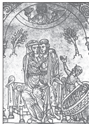
Cilj vsakega zakona: rojstvo otrok.