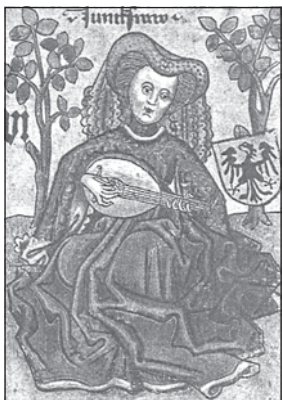
Igranje na instrument: eden od idealov vzgoje za plemiško deklico; igralna karta. Južna Nemčija ali Avstrija, 1453–1457. Dunaj, Kunsthistorisches Museum.

prihajali v pošte v tuji dvori, saj je bila v določeni starosti ločitev od staršev za določen čas običajna vzgojna metoda. 81