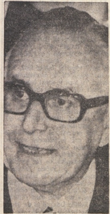
Ministrski predsednik Rumor

RIM, 13. — Po končanih posvetovanjih s predstavniki političnih strank in parlamentarnih skupin je tiskovni urad predsedstva republike objavil sledeče sporočilo: «Predsednik republike je po končani posvetovanjih, upoštevajoč resen gospodarski položaj in potrebo, da se dajo nujne pobude, da se brez zavlačevanja in omahovanja omogoči gospodarski napredek, zavrnil odstop vlade in jo povabil, naj se potrdi in naj stori vse, da se doseže sporazum v občo korist države.»