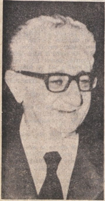
Predsednik republike Leone

Predsednikova odločitev je nekoliko presenetila politične kroge - Sedaj se bo morala vlada predstaviti parlamentu za zaupnico