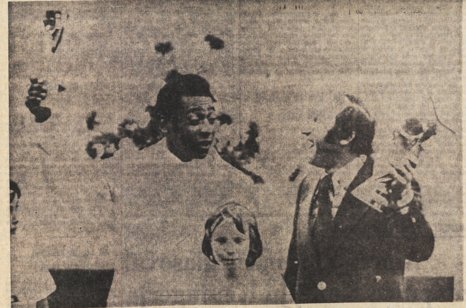
Na včerajšnji slovesnosti na frankfurtskem nogometnem stadionu sta si Pele in Seeler izmenjala kopiji pokalov Rimet in FIFA

NICA, 13. - V šestem kolu šahovske olimpiade v Nici vodi Jugoslavija v tekmi z Venezuelo z 2,5 proti 1,5 ter je prva na časni lestvici tretje izločilne skupine z 19,5 točke ter tremi prekinjenimi partijami. Druga je Kuba z 19 točkami ter dvema prekinjenima partijama.