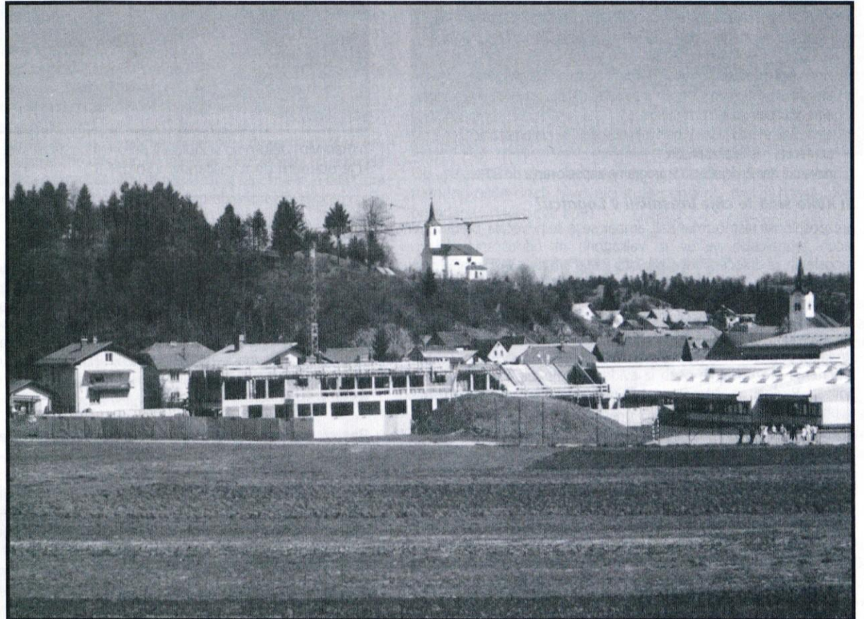
Ob gornjelogaški šoli raste prizidek, namenjen novemu otroškemu vrtcu. Kmalu bo pod streho.