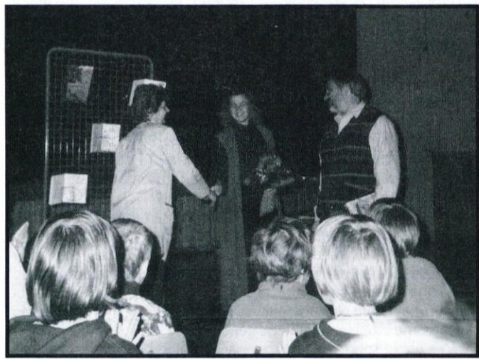
Zahvala za obisk