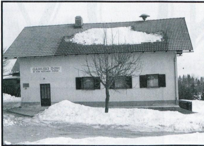
Z marljivim delom so si Žibřřani pred leti postavili svoj gasilski dom, ki je obenem dom vařřčanov.