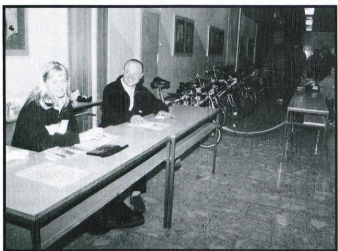
Utrinek s 1. kolesarskega sejma v Logatcu: strokovni nasveti so dobrodošli.