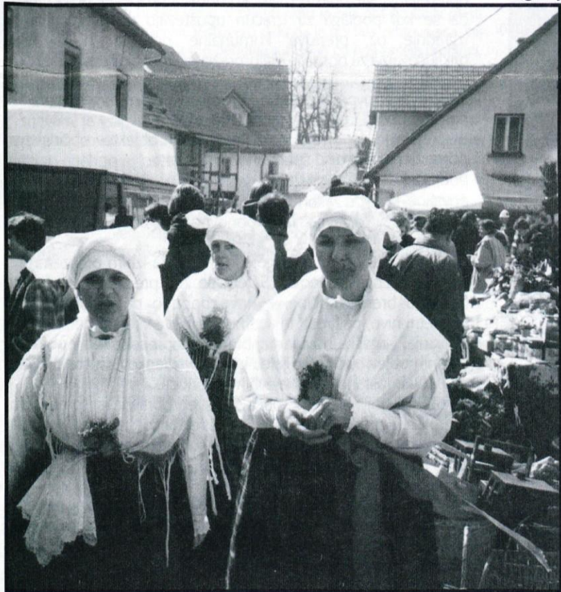
Sejmski utrip je bil živ in pisan. Na fotografiji gostje iz Repna med sprehodom po Cankarjevi.