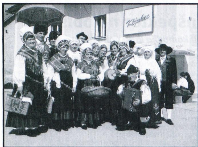
Ob sejmskih stojnocah so se družno nekajkrat sprehodili v narodne noše odeti Medveji in Repenci ob zvokih harmonike in brundanju lončenega basa.

PRISPEVKE ZA NASLEDNJO ŠTEVILKO NOVIC SPREJEMAMO DO 12. APRILA Uredništvo