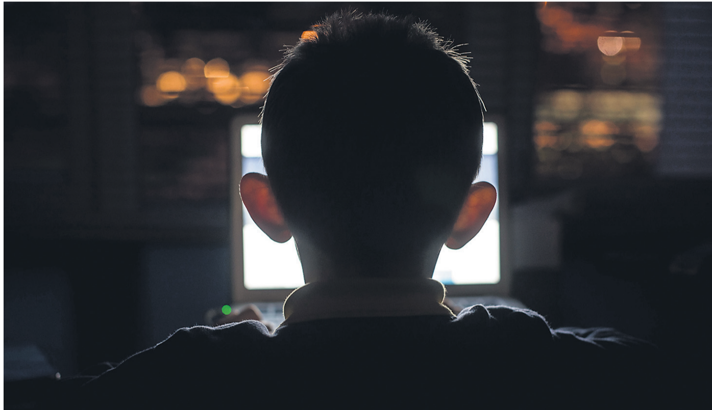
Zlasti na starših in skrbnikih je odgovornost, da spremljajo, s kom in kaj otroci komunicirajo po svetovnem spletu. (Pre)hitro se lahko zgodi, da otroka v klepetalnici na vabo ujame kakšen perverznejši ali pedofil.

Na Policijski upravi (PU) Maribor so povedali, da slovenski policisti letos v primerjavi z enakim obdobjem lani beležijo porast števila kaznivih dejanj s področja spletne kriminalitete in spolnih zlorab otrok. Kazniva dejanja, povezana s spolnim izkoriščanjem otrok, se najpogosteje kaznujejo