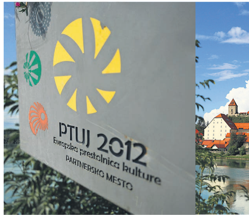
Nadaljevati kandidaturu za EPK ali ne, to bo zdaj vprašanje

Predlog, ki je pripravljen za naslednjo sejo, od svetnikov zahteva, da se do tega opredelijo, zgovorna pa je obrazložitev, v kateri med drugim piše, da MO Ptuj, ki že več let posluje na robu svojih finančnih zmogljivosti, glede na zaostrene okoliščine in pričakovane učinke tega projekta ne bi zmogla izpeljati v predvidenih okvirih. V predlogu sklepa je še navedeno, da bo kandidatura, če jo bodo nadaljevali, prilagojena razmeram: vsebinsko in finančno.