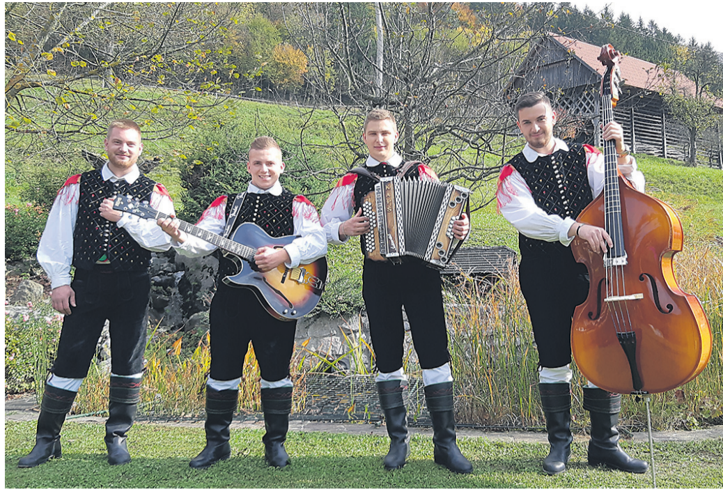
Ansambel Krimski lisjaki

»Igramo staro narodno-zabavno glasbo, ki jo bogati štiriglasno