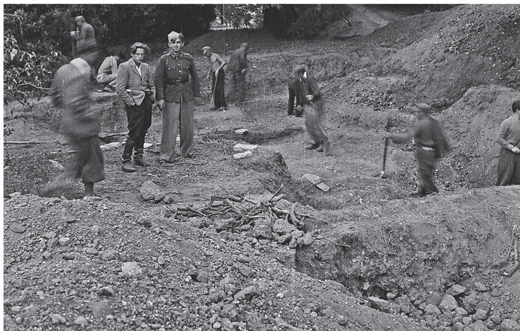
Nemški vojni ujetniki med delom na zahodnem platuju in njihovi stražarji vojaki jeseni leta 1946

Nekdanji direktor mariborskega muzeja Franjo Baš je prvi javno izra-