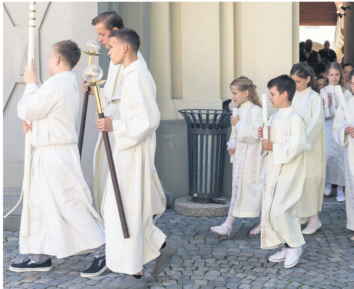
Prvo sveto obhajilo na Ptuj

V župniji sv. Marjete v Gorišnici bi otroci zakramenta prvega sv. obhajila in sv. birme prejeli v tem mesecu. Birno so načrtovali za 3. in prvo sveto obhajilo za 17. maj,