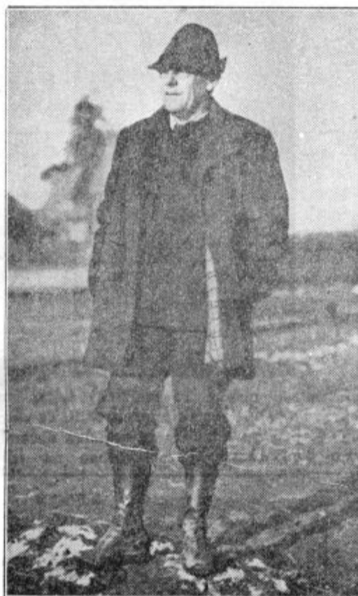
Dr. Vladko Maček, voditelj hrvatskih kmetov, nosilec vsedržavne opozicijske liste.