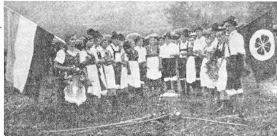
Kmetjski fantje in dekleta iz Bohinja okrog jerbasa, pri petju mladinske himne »Zeleni prapor«.

2. Poudariti, da se smatramo za stanovsko in nacionalno organizacijo, ki je slovenska, jugoslovanska in splošno slovanska in ki v skupnem in složnem delu vidi edini pogoj za zboljšanje