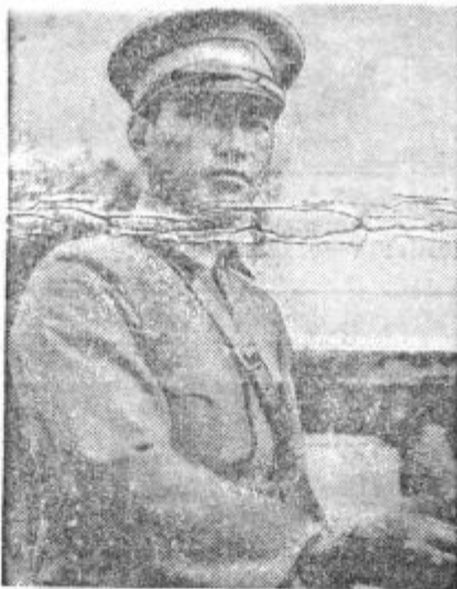
Maršal Čang kajšek, čigar armada je pred kratkim uničila 20 tisoč Japoncev.