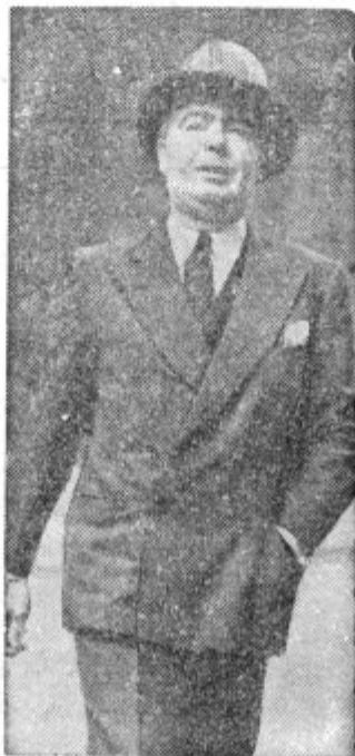
Angležem se menda že marsikaj svita, zato hočejo svojo vojsko temeljito preurediti. To važne nalogo je prevzel minister za narodno obrambo Hore-Belisha, ki ga vidimo na sliki.

prosil, naj bi Nemčija posredovala in pospešila čimprejšnjo mirno likvidacijo tega spora.