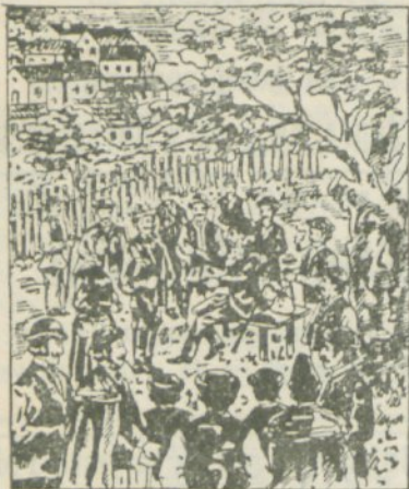
Vidmanić kaže seljanom moč „Pakraških kapljic in Slavonske biljevine.“