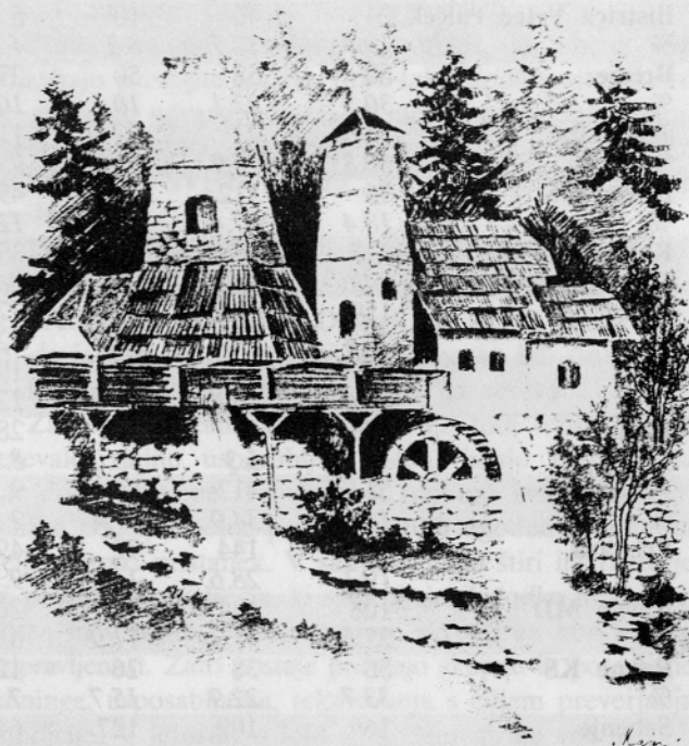
PLAVŽ NA ČADOVLJAH V TRZIČU OB LOMŠČICI (STAVBNA DEDIŠČINA PLAVŽARSTVA IN FUŽINARSTVA OB TRZIŠKI BISTRICI IN MOŠENIKU, GRAFIČNA ZBIRKA, AVTOR MIRKO MAJER)