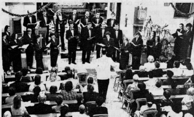
NASTOP V TRBOVELJSKI CERKVI