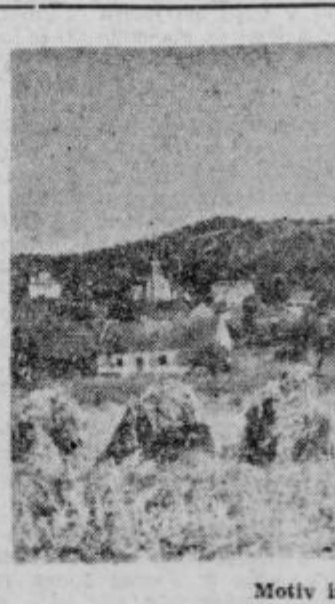
Motiv iz Juršinc

Sodniku za prekrške je bilo v zadnjem času poslanih tudi nekaj prijav, iz katerih izhaja, da nekatera podjetja živilske stroke ne posvečajo dovolj pozornosti pri proizvodnji najvažnejših živil. Tako je bilo ugotovljeno da je podjetje »Mesnine« v Ptujju prodajalo zaseko, ki je