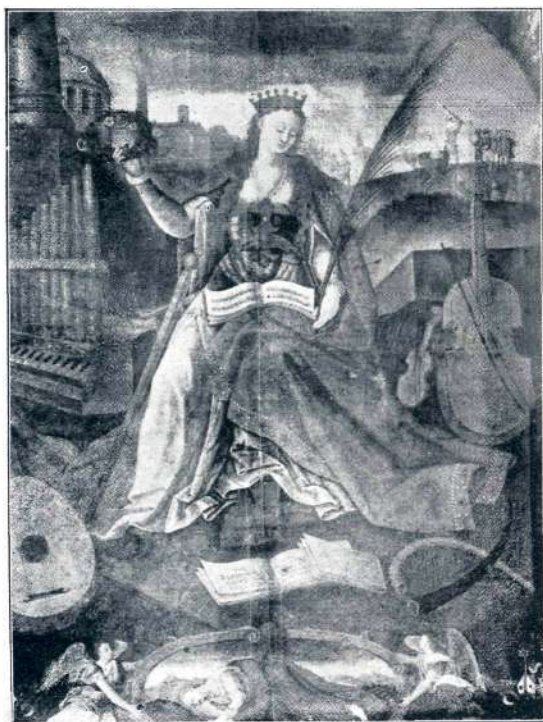
Sl. 33. M. Planner (?), sv. Cecilija (l. 1627.).