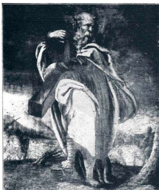
Sl. 34. Sp. Dolič, sv. Andrej (sr. XVII. stol.).