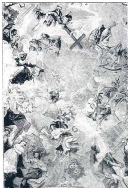
Sl. 32. Jamšek, freska na Skaručini (sr. XVIII. stol.).