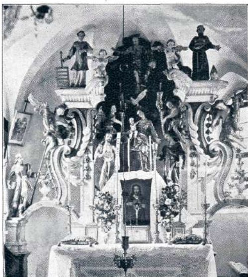
Sl. 31. Nadgorica, veliki oltar (2. pol. XVIII. stol.).