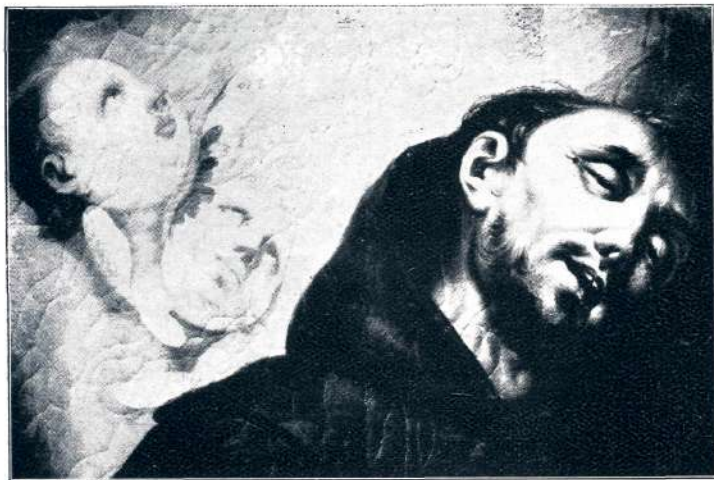
Sl. 29. F. Bergant, sv. Frančišek As. (detajl, sr. XVIII. stol.).