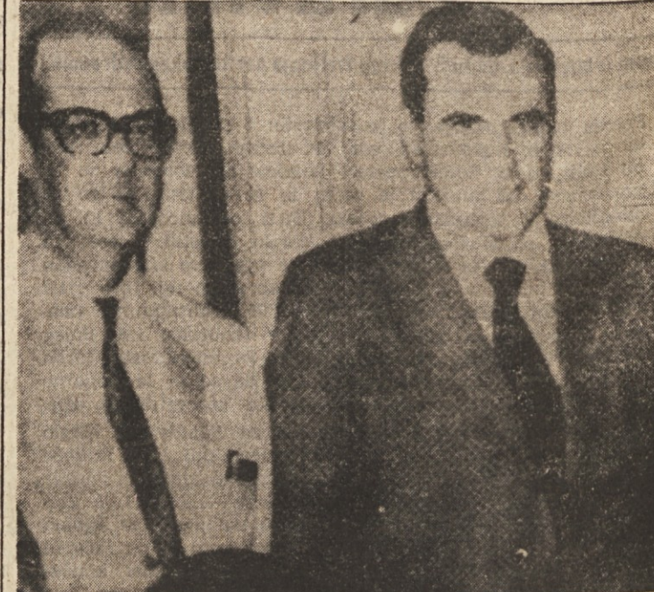
Urugvajski predsednik Bordaberry (desno) po državnem udaru

Bordaberry in vojski lahko računajo na podporo brazilske vlade, ki bi bila baje zelo zadovoljna, če bi njena «politična fronta» prodira do Ria de la Plata.