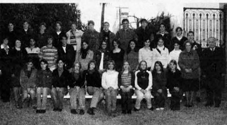
RAST XXXIII pred odhodom s profesorji

Napačno pojmovanje. Medtem je vlada slavila kot zmago, da na zadnjem protestnem shodu piketerov ni prišlo do izgredov. Dvojni pas železne ograje in policistov je preprečil nov napad na mestni parlament. Vendar se zdi, da vlada napačno pojmuje. Ni logično, da zaradi policijskega aparata ne pride do spopadov. Normalen državljani, tisti ki v potu svojega obraza od zore do mraka služi svoj kruh, pričakuje (upravičeno), da lahko mirno stopa ali se vozi po prostih ulicah in da se njegovi davki uporabljajo bolj smotrno kot pa za financiranje poklicnih nastopcev mafijskega predznaka.