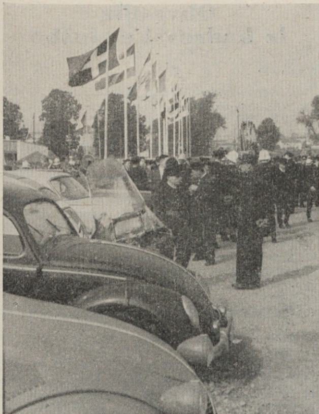
Vhod v tabor gasilcev

niso kos požaru, pa obstojajo v mestu 4 prostovoljna gasilska društva s po 100 člani, kateri pa imajo signalne naprave vezane direktno na telefonsko centralo poklicnih gasilcev. Ko telefonist z enim gibom alarmira vseh 100 gasilcev, na armaturni deski takoj vidi, koliko jih je pripravljeno za sodelovanje. V kolikor jih iz enega društva ni dovolj, takoj alarmira še drugo. Zanimivo je tudi odpiranje vrat. Odpiranje je avtomatično potom fotocelice.