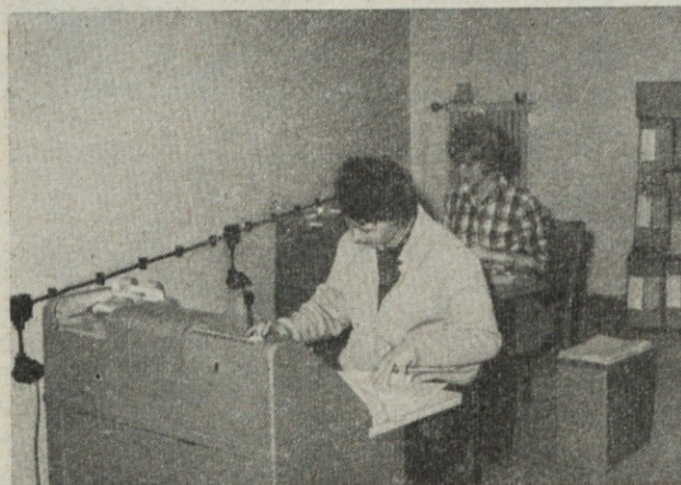
Delo na IBM strojih

Vse navedeno je močna ovira pri uvajanju naših obračunov na strojih višje mehanizacije s posebnim ozirom na to, da smo v tem delu začetniki.