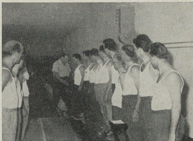
Kegljaška sekcija TVD »Partizan« Jarše Versus kegljaški klub Količevo

V splošnem zaznamujemo velik napredek od onega dne, ko smo podrli prve keglje še na starem kegljišču v Domžalah. Takrat je bilo na večer skupaj toliko plank, da so znesle kazni pri posamezniku tudi do 300 din, s katerim denarjem smo krili