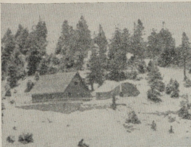
Naš dom na Mali planini