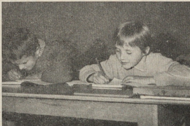
Šola v Novih Rojah — med poukom

Uprava šole ima svoje prostore na severovzhodnem delu poslopja. Tu je posebni prostor za upravitelja šole, za tajnico, prostorna in svetla je nadalje konferenčna soba za predavateljski kader in poseben prostor za razgovore predavateljev s