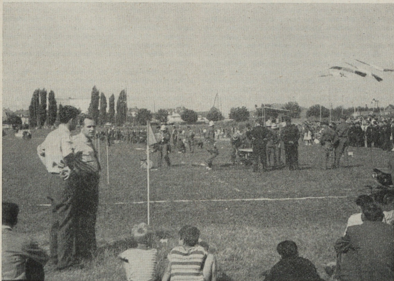
Tekmovanje v Milhousu

Za zaključek je priredil župan mesta St Louis svečano večerjo. To je bila resnično še ena manifestacija velikega medsebojnega prijateljstva. Ko smo se poslavljali je bilo slišati križem po dvorani »Na svidenje čez tri leta v Jugoslaviji«. Nekateri tekmovalci so odpotovali že v nedeljo ponoči. Ljubljanci in mi pa smo bili povabljeni, naj obiščemo gasilce v Baselu. Vabilu smo se radi odzvali, da smo videli način njihovega dela. Predsednik II. prostovoljnega gasilskega društva s člani nas je sprejel na postaji, nakar nam je razkazal živalski vrt in del mesta, njihovo orodjarno, v kateri sta bila dva gasilska avtomobila in 8 avtomobilov civilne zaščite, katere pa lahko v slučaju potrebe uporabljajo tudi gasilci. Obiskali smo tudi poklicne gasilce. V dveh garažah imajo 28 gasilskih avtomobilov, zelo moderno opremljenih, saj ima vsak 4. radiovezo. V slučaju, da je večja akcija, da sami