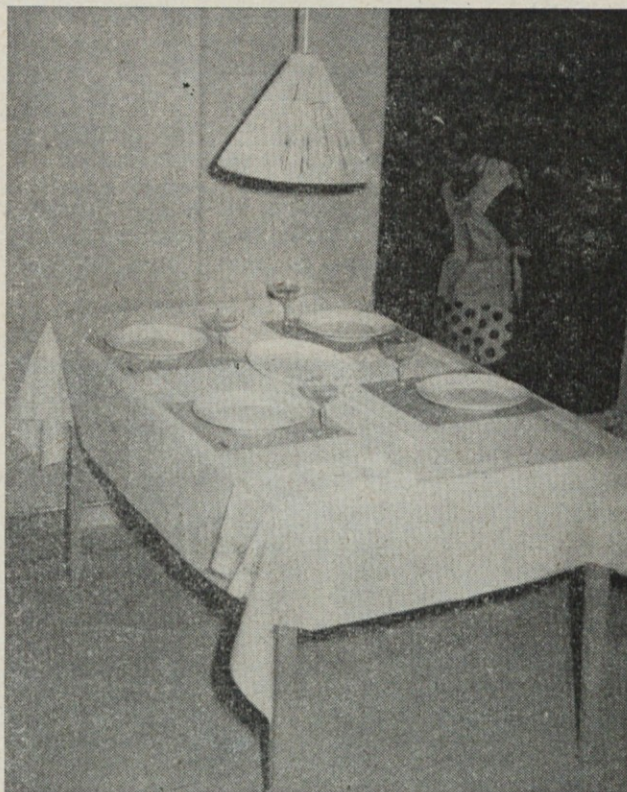
S Sejma 1963 na GR

Omeniti je torej, da se sredstva, ki se vložijo v pravilne reklamne svrhe, dobro obrestujejo in je potrebno tudi v bodoče tako postopati.