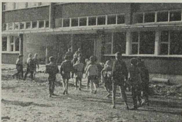
Pred pričetkom pouka

Otvoritev šole bo 29. novembra in to bo poseben praznik za vse nas, posebej pa za 381 otrok, ki obiskujejo novo šolo in od katerih jih je samo v dveh prvih razredih 47. To bo velik praznik in pot k boljšemu posredovanju znanosti za 19 predavateljev nove šole in to bo eden najlepših spomenikov naše revolucije in socializma, s katerim gremo skupno lepšemu življenju naproti.