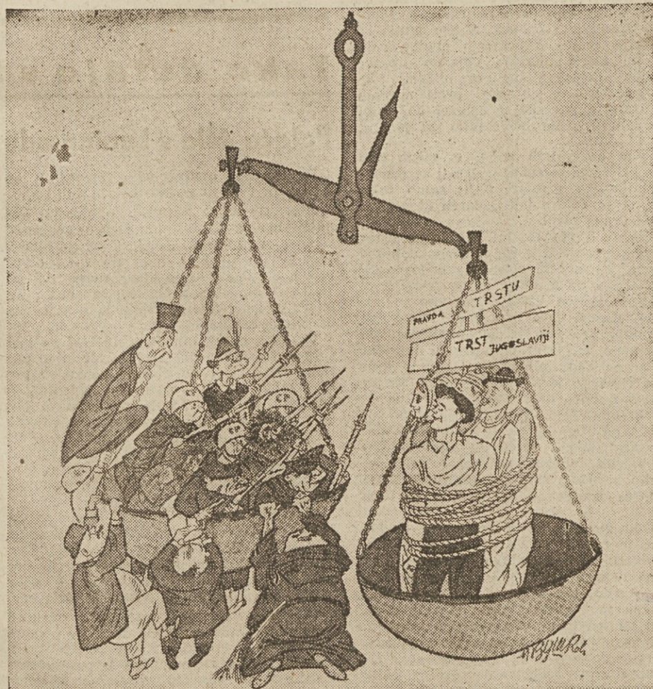
Potegnimo, gospoda, malo na to stran; naj vidi svet, da smo mi za ravnotežje