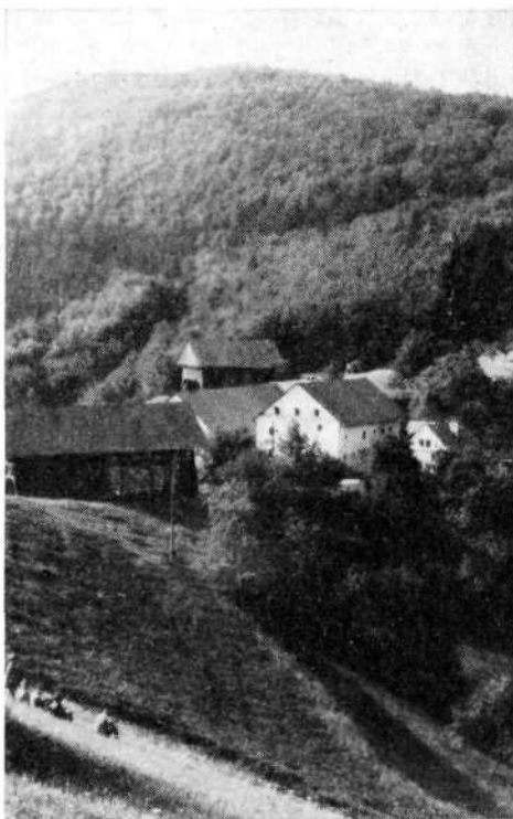
Skoblova kmetija in Pasja ravan